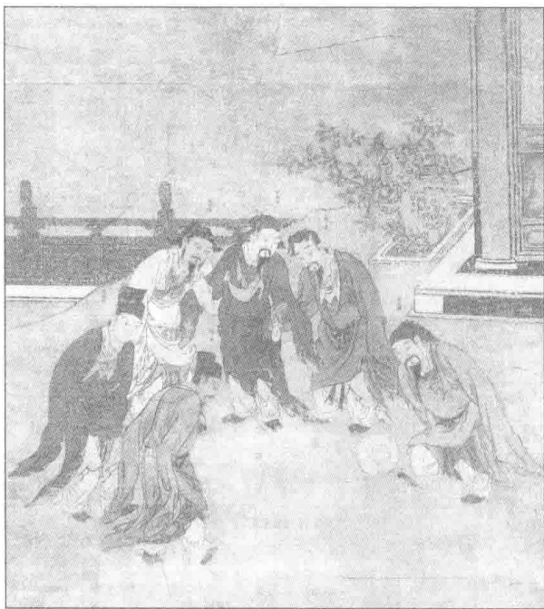
原作北宋苏汉臣，元代胡廷晖临摹品。