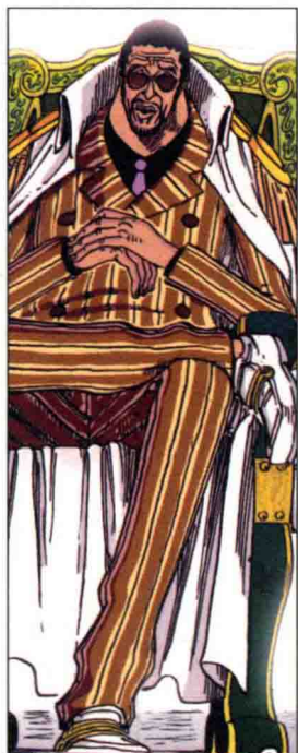
MARINE HEAD- QUARTERS ADMIRAL KIZARU (BORSALINO)

然而，原本的三大将中，“赤犬”成为了新的海军元帅，“青雉”战败后独自出走，只有“黄猿”一人还在。换句话说，三大将的位置出现了两个空缺，那么这两个新的海军大将会是谁呢？这是一个非常值得期待的问题。在漫画连载的最新篇中，元帅“赤犬”让“藤虎”前去调查。随后在德克斯罗萨岛上，路飞他们就偶遇一名实力极其可怕的盲眼武士。并且在随后的剧情中我们得知，这个名为“藤虎（伊晓）”的盲人就是新任大将之一。至于另外一个海军大将，则叫做“绿牛”！