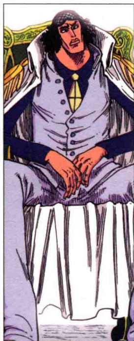
MARINE HEAD- QUARTERS ADMIRAL AOKIJI (KUZAN)