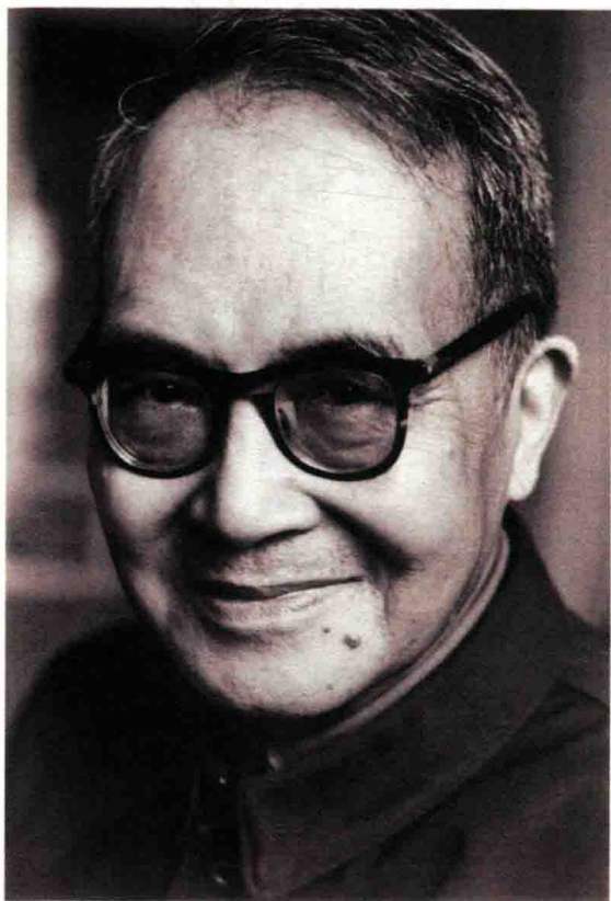
钱鍾书先生