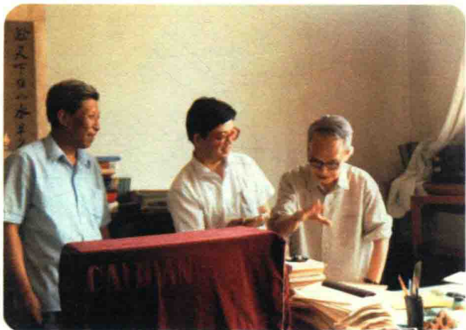
钱锺书先生与栾贵明先生、纪红先生合影