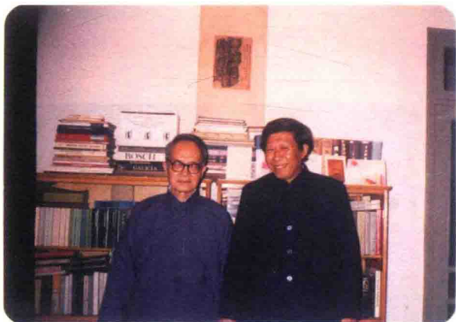
钱锺书先生与栾贵明先生合影