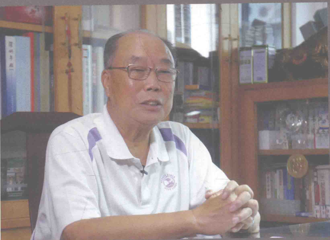
2015年11月12日，厉有为讲述在深圳工作八年间的点滴经历

厉有为，1938年生于辽宁省新民市，1983年10月后开始出任地方党政机关领导职务，先后任湖北省十堰市市委副书记，十堰市市长、市委书记，湖北省副省长。1990年12月调任广东省，任中共深圳市委副书记、市人大常委会主任兼深圳市委党校校长。1992年6月任中共广东省委常委，同年11月任深圳市市长。1993年4月任中共深圳市委书记兼市长。1998年3月任第九届全国政协常委、港澳台侨委员会副主任。