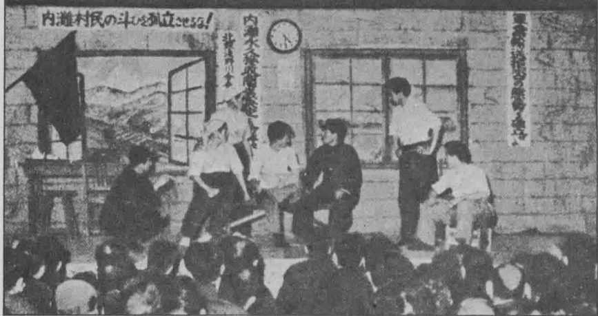
日本戦犯晩會——演出自編話劇「内灘村」。