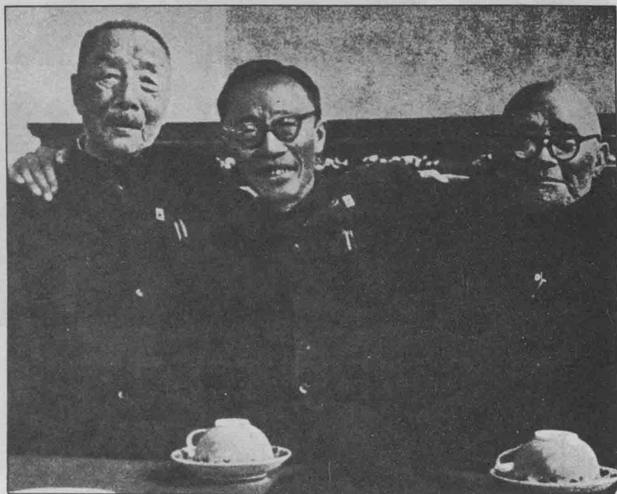
辛亥革命五十周年紀念日：溥儀與鹿鍾麟（左）、熊炳坤（右） 合攝於北京「全國政協」。