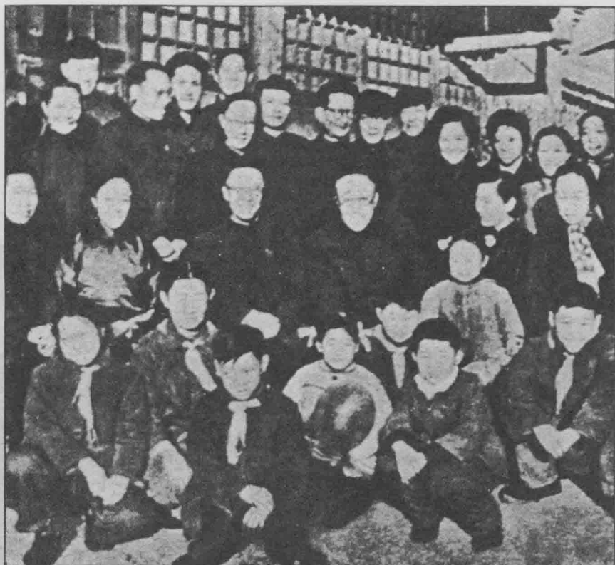
老少三代：1961年春節在載濤家中。