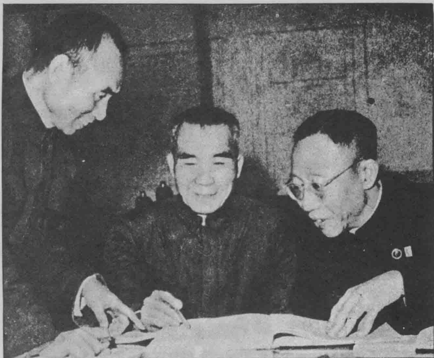
溥儀參加文史研究工作後與楊伯濤（左一）、王耀武（左二）合攝於「政協」。