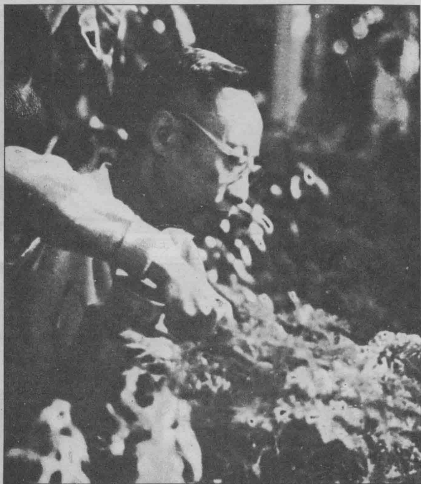
溥儀在北京植物園工作。