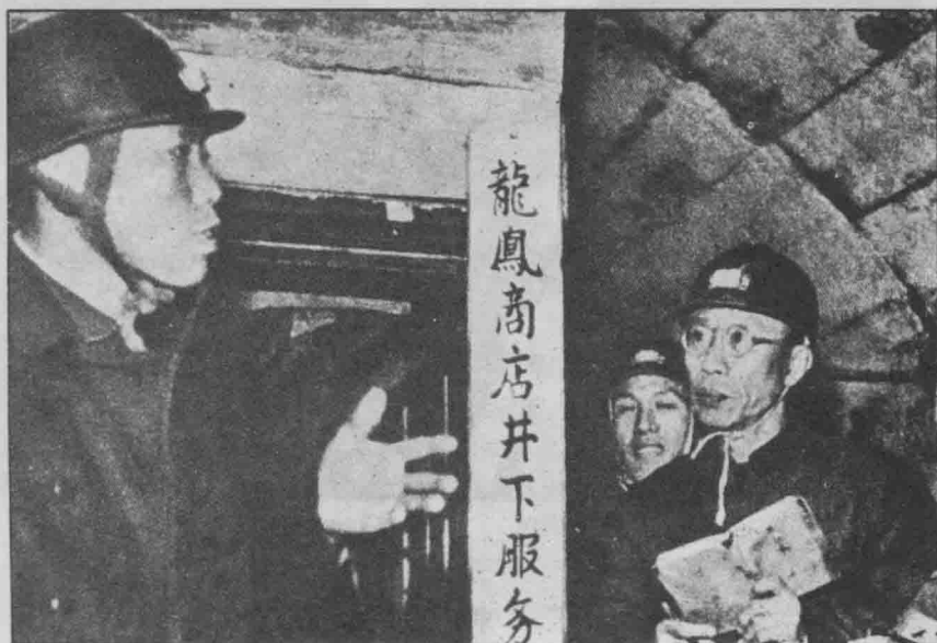
溥儀參觀撫順礦區。