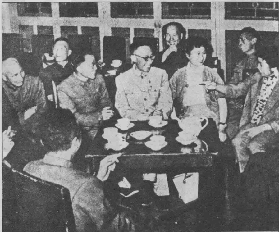
婚禮中的一角（一九六二年五一節）左起中排：王耀武、范漢傑、 杜聿明、溥儀、李淑賢、鄭庭笈夫人 前排：沈醉、周振強 後排：李以勳、杜建時、鄭庭笈