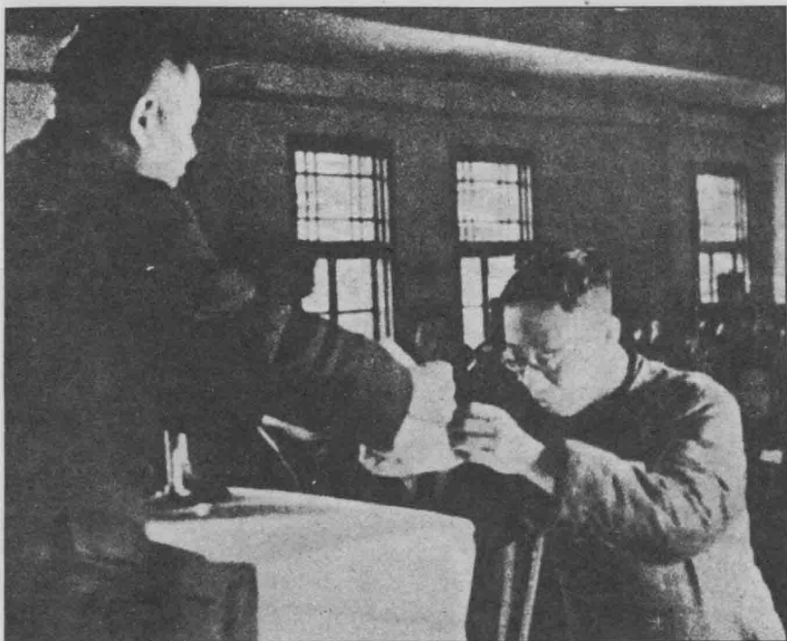
1959年12月4日溥儀獲中共「特赦」。