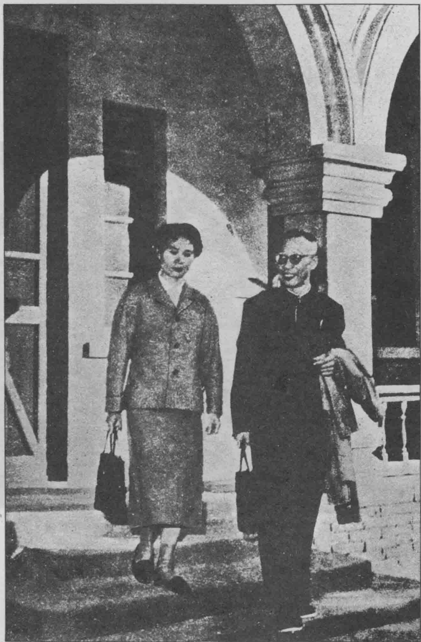
溥儀和妻子李淑賢離家後去上班。