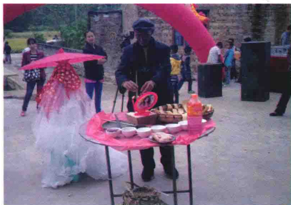
→ 摩师主办婚礼仪式