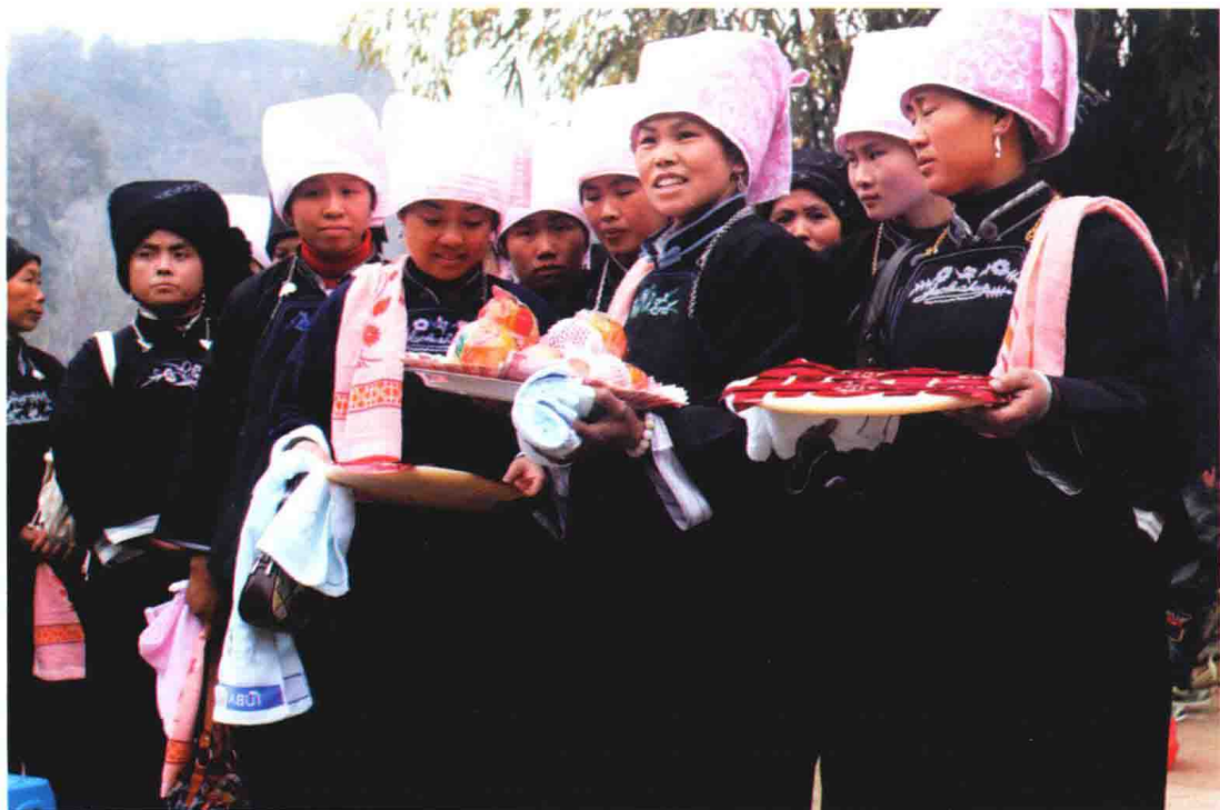
亲戚端着礼物进新郎家