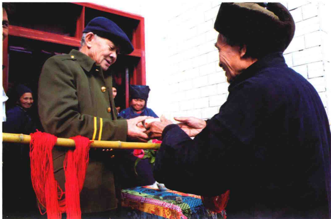
订亲对唱拦门酒歌