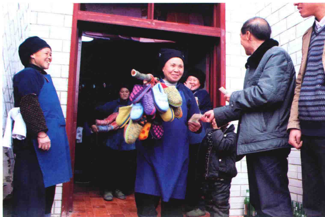
新娘家将嫁妆交给男方时，男方付娱乐钱