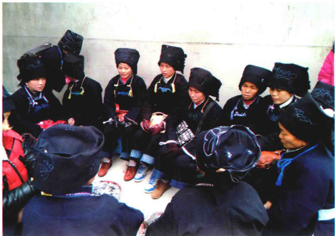
↓ 伴娘围坐等待婚礼仪式