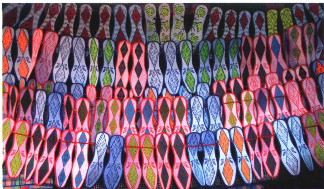
102 双鞋垫，喻意新娘百里挑一