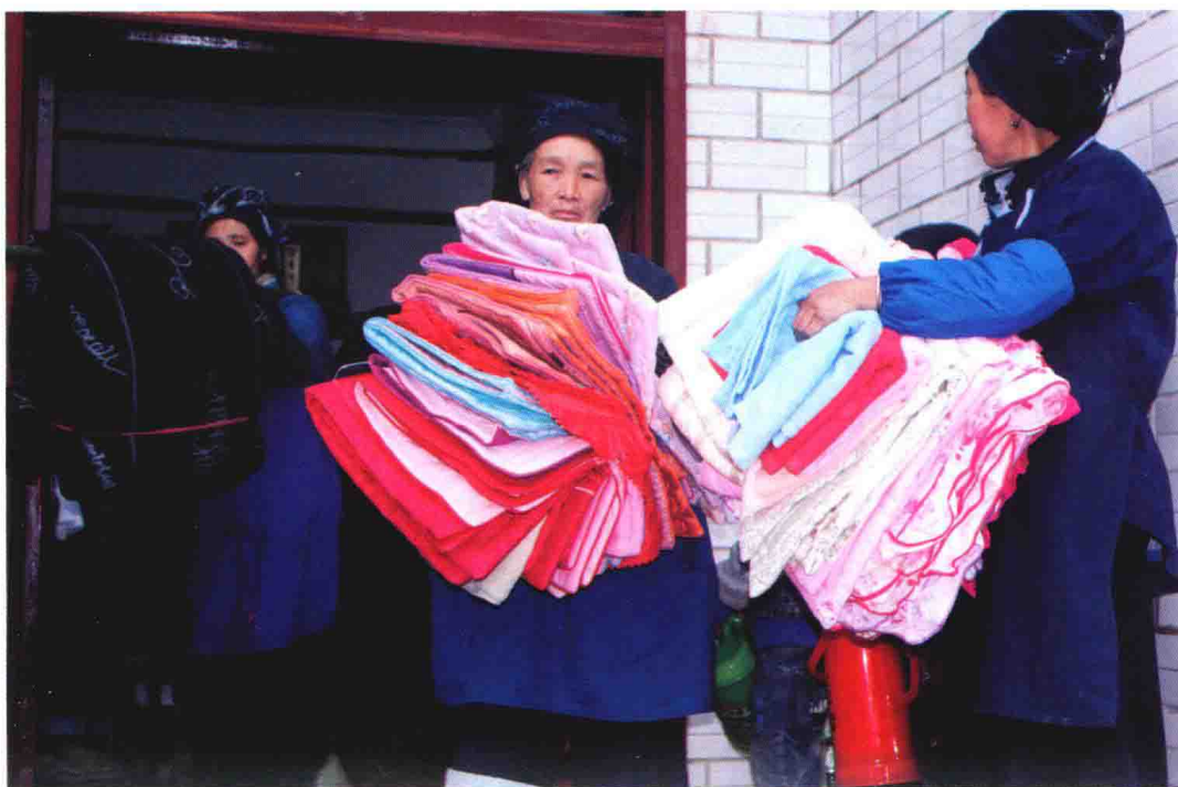
新娘家交给男方的嫁妆