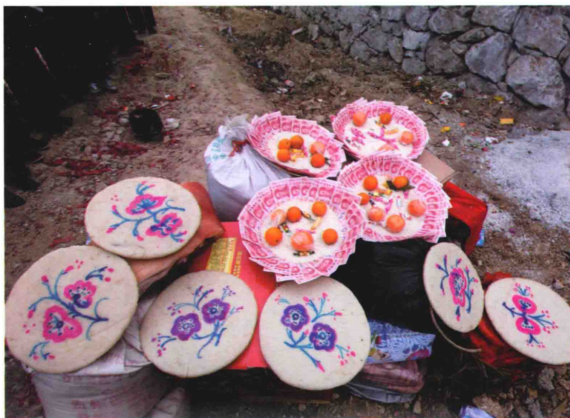
亲戚送来的贺礼-糍耙、礼金等