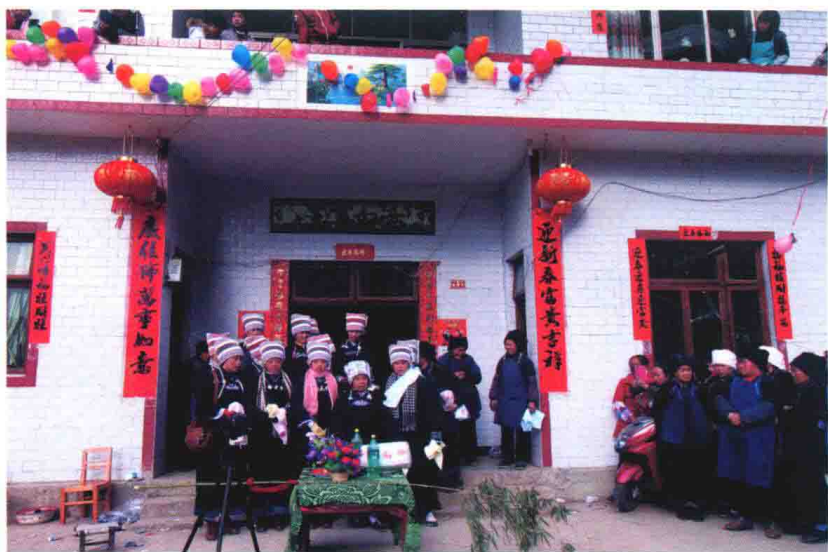
~ 堂屋前唱拦门酒歌