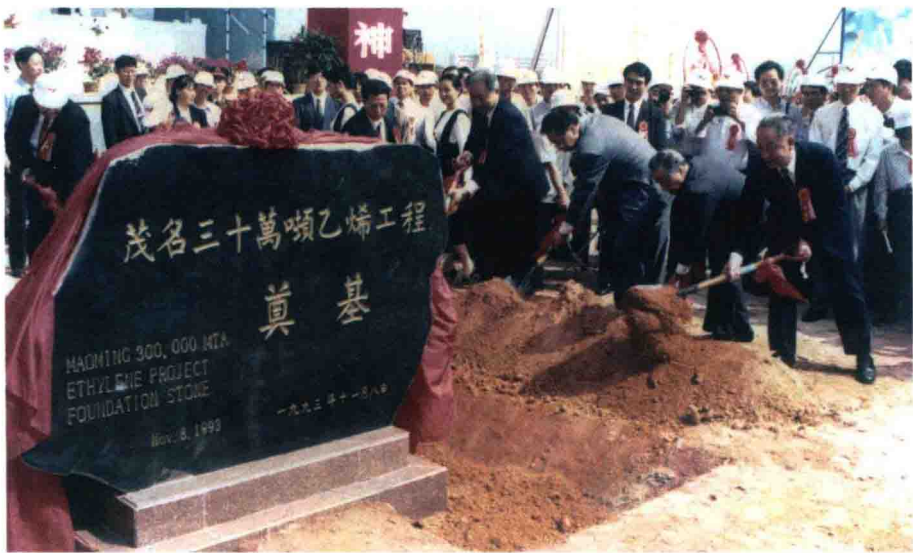
陈锦华参加茂名石化30万吨乙烯工程奠基仪式

在中国石化的发展历程中，尽管领导层几经变动，但以人为本、关爱员工的优良传统一脉相传，并且随着时代的变化不断充实细化，成为企业凝聚力和吸引力的坚强基石和优秀企业文化的重要因子。