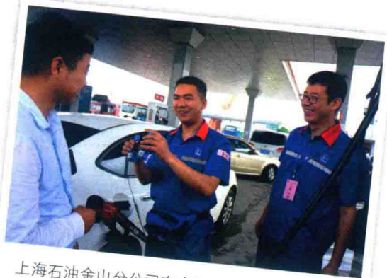
上海石油金山分公司在金枫462加油站组织开展“寻找身边的燃油宝王”燃油宝现场销售比赛

我大学毕业进入上海石油已有5个年头。前不久通过竞聘走上了高桥石油站基层带班长的岗位。一改往日“朝九晚五”的节奏，步入了三班倒的生活，如今迎来生平第一个没有长假的国庆节。看着朋友圈里兴起的新一轮爱国热潮——“最近啥都不想干，就想给祖国过生日”，未免有那么一丝苦涩，于是评论道：“今天十一，我夜班。”