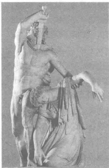
古希腊雕塑：自杀的高卢人

以高卢人为首的凯尔特人，在历史上曾与希腊和罗马都发生过惨烈的冲突。在亚里士多德笔下，高卢人极其好战又性格残酷。