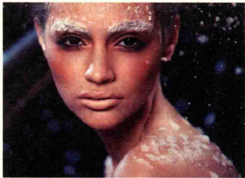
图 1-14 秋季型人的色彩运用

秋季型人化妆时应选择温暖、浓郁的颜色，可在相同的色相间搭配或者相邻色间搭配，如图 1-14 所示。秋季型人常用的颜色包括金色、橙色、砖红色、棕色、苔绿色、橘色及带珠光的颜色。