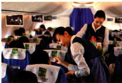
图 1-2 工作中的空乘人员

声音的美学效果是不言而喻的。形象设计非常重视维护和重建人体发音器官及发音功能，并将声音列为仪态美的一个重要组成部分。中国人讲究“听其言，观其行”，并把声音、谈吐作为考察人品的重要内容。语音轻柔、语意完整、语调亲切、语速适中等都能够反映出言谈者良好的品德修养和文化素养，如图 1-2 所示。