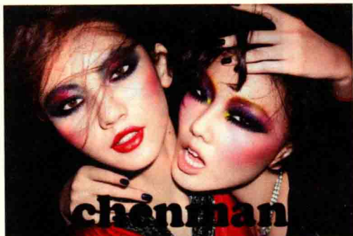
图 1-10 眼妆的冷暖对比

色彩原本没有冷暖之分，人们通常说的色彩冷暖是人的一种心理感受。暖色使人感到温暖，如看到红色会使人联想到火苗，让人感到温暖。冷色使人安静，如看到蓝色会使人联想到大海，让人安静。化妆时，暖色系妆面加入冷色点缀，会使妆面显得更加温暖，如图 1-10 左图所示。相反，冷色系妆面加入暖色点缀，会使妆面显得冷艳，如图 1-10 右图所示。