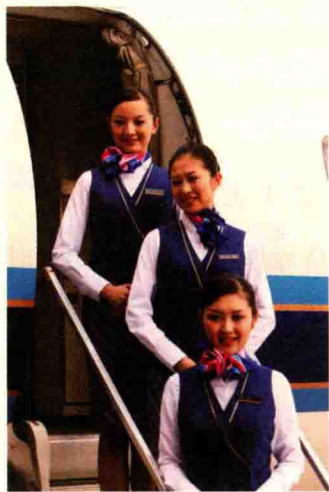
图 1-1 空乘人员形象

爱好、职业、文化素质、经济水平和社会地位等，如图 1-1 所示，同时还体现着民族习惯和社会风尚。