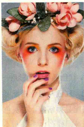
图 1-5 邻近色对比眼妆

(3) 邻近色对比指色环上 90^\circ 以内颜色的对比,如橙色与红色、黄色与绿色、蓝色与紫色的对比等。邻近色容易调和,而且色彩的变化要比同类色丰富,可用于民航服务人员的职业妆中。在运用时,应注意加强色彩明度和纯度的对比,使邻近色的变化范围更广。在化妆时,可使用邻近色进行对比,也可与同类色对比搭配进行妆面的处理,使妆面效果显得柔和。如图 1-5 所示。