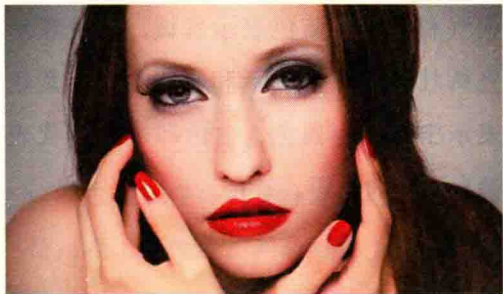
图 1-15 冬季型人的色彩运用

冬季型人化妆时最好选择搭配无色彩系、大胆热烈的纯色系及鲜艳的冷色系。冬季型人常用的颜色包括无色彩系如黑、白、灰色，纯色系如正红、正蓝、正绿、正黄、桃红、酒红等，以及冷色系如宝蓝色等，如图 1-15 所示。