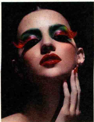
图 1-4 互补色对比眼妆

(3) 邻近色对比指色环上 90^\circ 以内颜色的对比,如橙色与红色、黄色与绿色、蓝色与紫色的对比等。邻近色容易调和,而且色彩的变化要比同类色丰富,可用于民航服务人员的职业妆中。在运用时,应注意加强色彩明度和纯度的对比,使邻近色的变化范围更广。在化妆时,可使用邻近色进行对比,也可与同类色对比搭配进行妆面的处理,使妆面效果显得柔和。如图 1-5 所示。