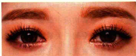
图 1-9 色彩弱纯度对比