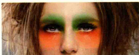
图 1-8 色彩强纯度对比

纯度对比是由于色彩纯度的差别而形成的色彩对比效果。色彩中的纯度对比可分为强对比和弱对比两种。强对比使画面明朗、富有生气，色彩认知度也较高，效果强烈，但反差较大，如图 1-8 所示。弱对比的画面的视觉效果比较弱，形象的清晰度较低，但对比效果和谐、含蓄、自然、柔和，如图 1-9 所示。民航服务人员在化妆时，要根据妆面需要选择色彩纯度的强与弱。