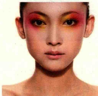
图 1-12 春季型人的色彩运用

春季型人在化妆时颜色不能太沉暗,色彩运用要鲜明,如图 1-12 所示。在化妆过程中,可以选择黄绿、亮橘、杏色、象牙白、浅棕、浅褐色系、浅驼色等。