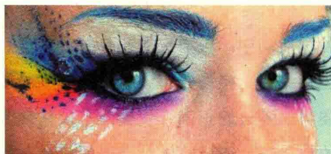
图 1-3 对比色对比眼妆

(1) 对比色对比指三个原色（红黄蓝）之间的对比，属于强对比。一般不用于民航服务人员的职业妆中，如图 1-3 所示。