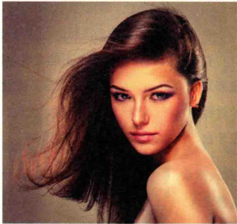
图 1-13 夏季型人的色彩运用

夏季型人化妆时，适合运用同一色相的颜色进行浓淡的搭配，也可以按蓝灰、蓝绿、蓝紫等相邻色相进行搭配，如图 1-13 所示。夏季型人常用的颜色包括所有的粉彩冷色系，如粉蓝、粉红、粉紫、粉绿等；和所有带烟灰的冷色系，如灰蓝、灰绿、豆沙色等。