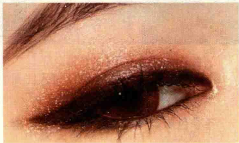
图 1-11 咖啡色眼妆

咖啡色称为化妆中的“万能色”,是“最安全”的颜色,给人成熟、稳重、内敛、中庸、温暖、安静的感觉,可与任何颜色搭配,最适合与米色、金色、黑色、红色搭配,如图 1-11 所示。