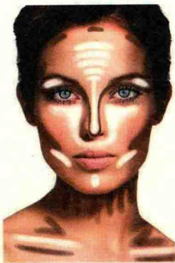
图 1-7 色彩明度对比

明度对比是色彩明暗程度的对比,深与浅的对比,也称色彩的黑白度对比。明度对比是色彩构成中最重要的因素,色彩的层次与空间的关系主要依靠色彩的明度对比来表现。在化妆时,明度对比法常用于脸部修容中,利用深浅不同的颜色使较扁平的五官显得有立体感,如图 1-7 所示。