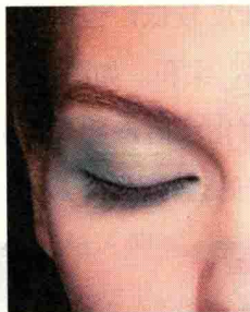
图 1-6 同类色对比眼妆

服务人员的职业妆中,例如,同类色对比常用于眼部的眼影颜色,可使妆面效果显得协调、柔和,如图 1-6 所示。同类色对比的缺点是容易使妆面显得单调,缺乏立体感,所以,在运用时应注意明度和纯度对比的变化,从而使对比效果丰富起来。