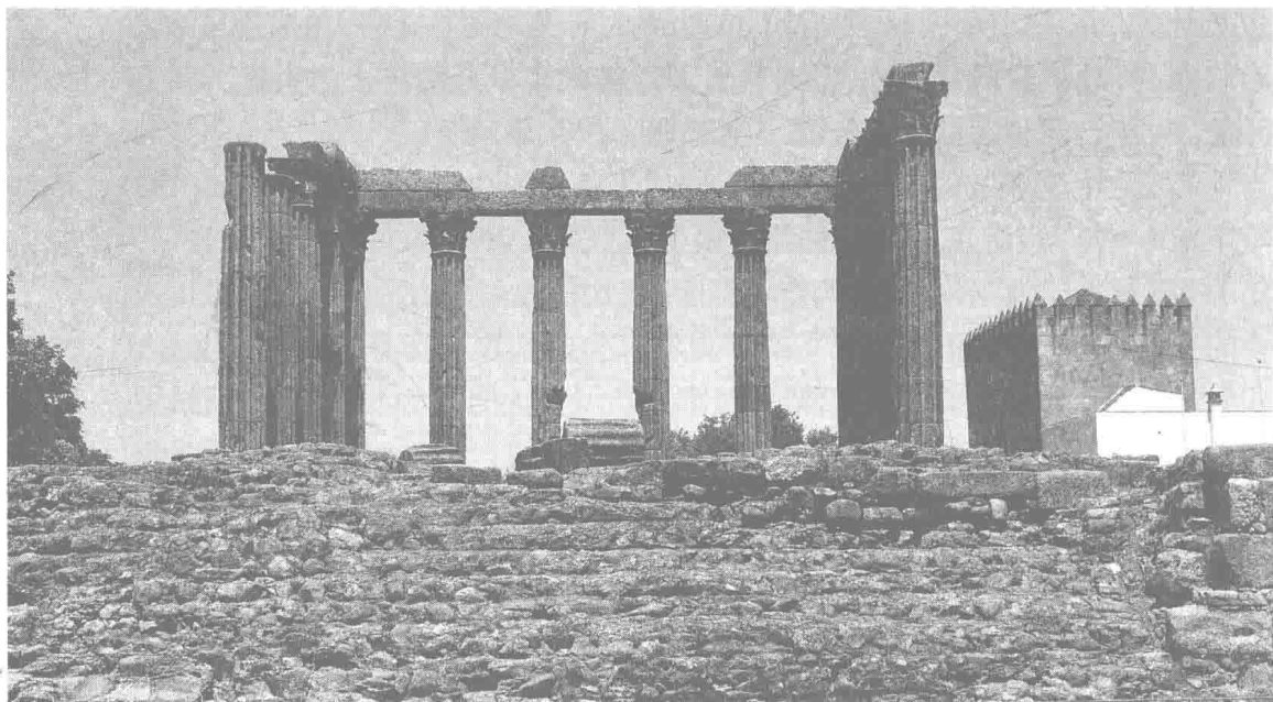
埃武拉的狄安娜神庙

军团必须驻扎在这里。军队是真正的殖民者,他们的许多营地成为后来的村落以及市镇的基础,甚至演变为大的城市。随着时间的推移,来自意大利亚平宁半岛的罗马商人以及殖民者也随着罗马的军团来到这片土地,兴建城市、凿通山丘,修筑典型的罗马式的水渠和道路。他们还将较为精致的农业耕作方法教给乡村居民。小麦、葡萄以及酿制葡萄酒的方法并不是由罗马人引进的,但是推广它们的却是罗马人。他们扩大种植这些作物的目的是为了增加出口,不完全是为了就地食用,但是随着食物供应的增加,半岛就能够供养更多的人口。这些农业结构上的变化带有永久性,因为小麦、葡萄和橄榄非常适应当地的气候和土壤条件,罗马人在与当地人在交往的过程中建立了耕作与商业的频繁的联系,许多当地人被招来为罗马人耕地,从事手工业的劳动,这种初期的接触就是文化的融合过程,其后果同样也是永久性的。许多居民走出起伏不平、古城堡垒星罗棋布的山区,移居到说拉丁语和实行罗马法的城市以及毗邻的平原,结束了与外界隔绝的部落自治生活。下山以后,这些人改变了居住的方式,开始用石头和砖砌墙,用瓦片铺盖房顶,不再居住在圆形的茅草小屋。当时人们使用的瓦和后来人们所说的“葡萄牙瓦”十分相似。这样,当地人也逐渐学会了征服者的语言以及生活习惯。在今天的里斯本曾有罗马人