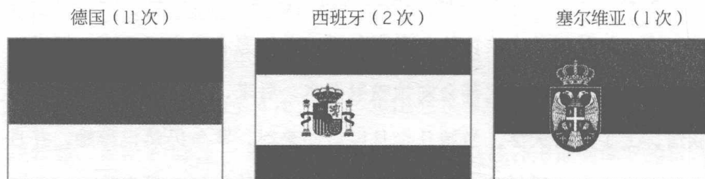
图 1.1 保罗最喜欢的国旗

国旗显然是一个混杂因素，因为保罗选择的并不是最佳足球队，而是它最喜欢的国旗。说到底，“无所不知的保罗”只是一只缺乏智商的章鱼而已。