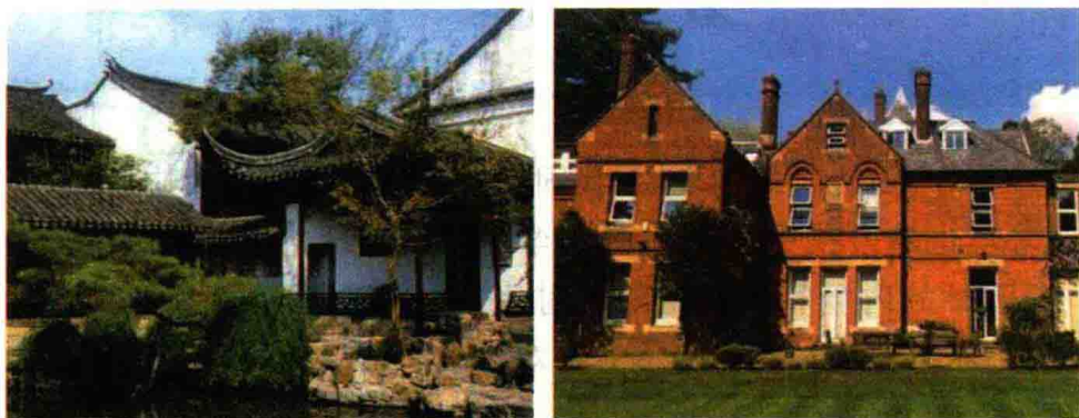
图 1-1 风格不同的中西方园林

中西方园林在文化传统、思维方式、社会背景等方面具有不同的特点,因而产生了各自不同的设计风格(图 1-1)。不论是中國还是西方,现代园林虽然与传统园林有较大区别,但二者始终具有一脉相承的关系。