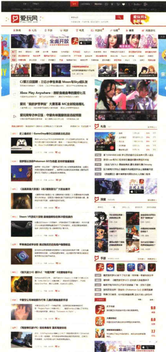
图 1-7 play.163.com 门户类栏目页