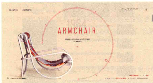
图 1-4 locus-solus.it 形象页

内容页顾名思义, 就是展示网站最终内容的页面, 也是网站最基层的页面(图 1-9)。