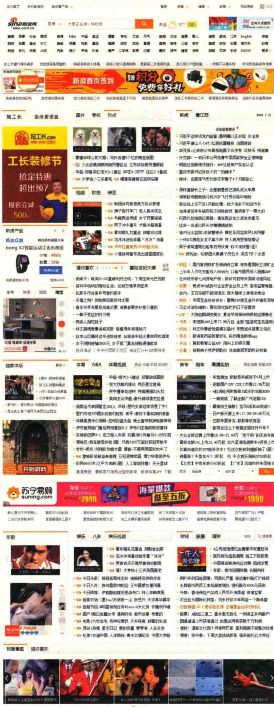
图 1-1 www.sina.com.cn 资讯网站