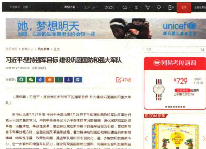
图 1-9 www.163.com 内容页