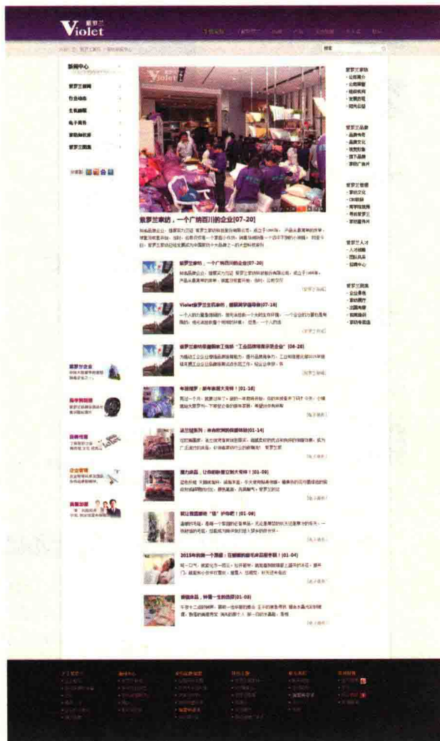
图 1-6 www.violet.com.cn 专栏类栏目页