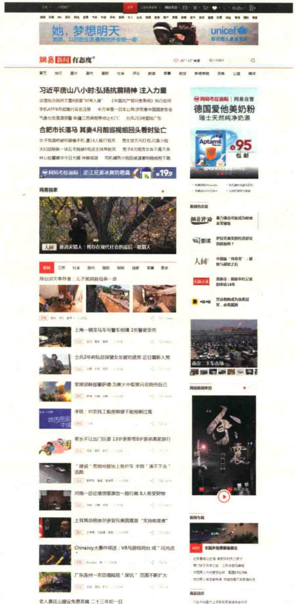
图 1-8 news.163.com 门户类栏目页