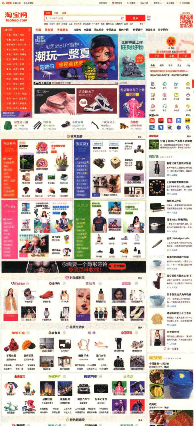
图 1-2 www.taobao.com 电子商务网站