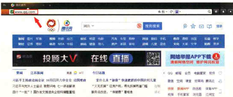
图 1-3 网站域名