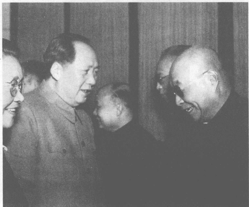
1956年2月毛泽东主席接见施今墨先生。左一为冯玉祥将军夫人、原卫生部部长李德全，右一为施今墨