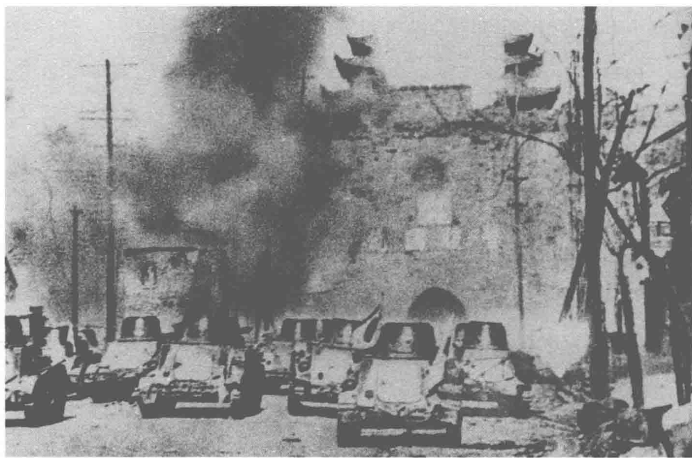
日军坦克侵入南京城

军令大如山，杀敌不后人。1938年上半年，新四军正处在草创时期，主力部队分散在大江南北，还没有来得及完成整训，而且在武器装备上不仅落后于日军，也落后于国民党军队。在这样的背景下，刚刚组建起来的新四军各部，不等不靠，边打边建，在战斗中锻炼成长。他