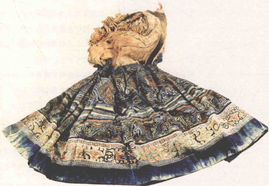
鹭鸟蜡染褶裙·南宋

然而服饰文化不仅是继承，而且要融合和发展，更要方便和实用。道学先生们一心复古守礼，禁来禁去禁而不绝，新服饰反而成了风尚，这也是社会风尚一定会与时俱进的一个证明吧。