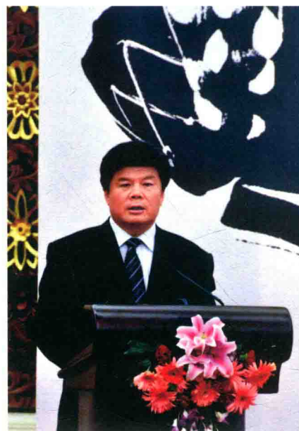
中国出版集团公司原总裁聂震宁 出席《羌山采風录》首发式并讲话