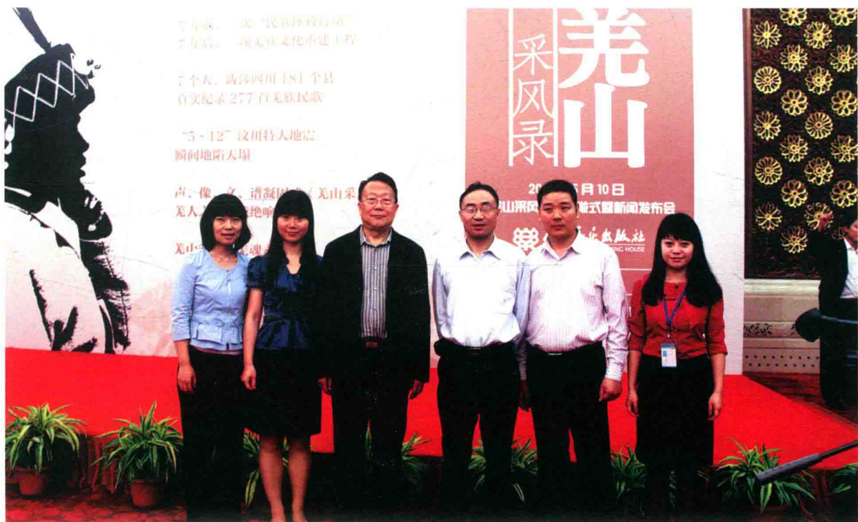
《羌山采風錄》 主創及編輯人員