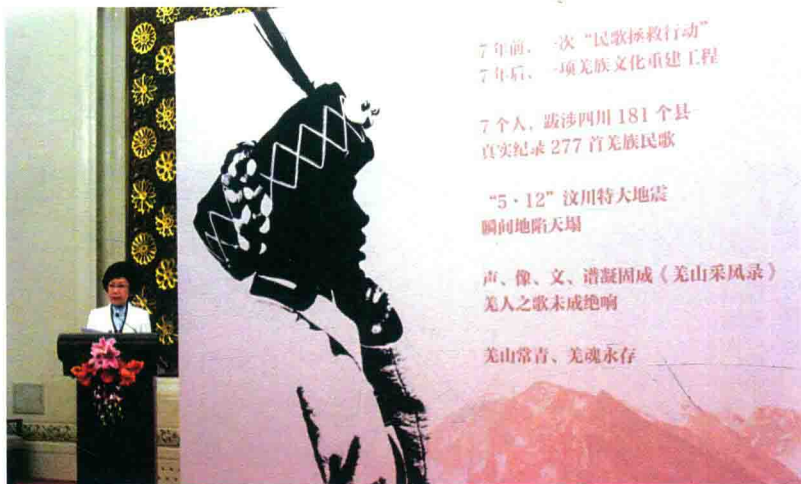
原新闻出版总署副署长李东东 出席《羌山采风录》首发式并讲话