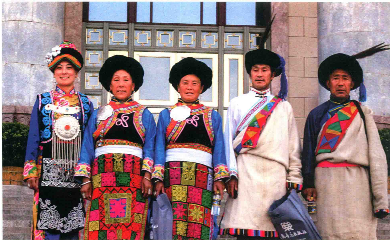
羌族歌手参加人民大会堂《羌山采风录》首发仪式