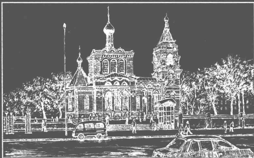
哈尔滨市 Harbin City