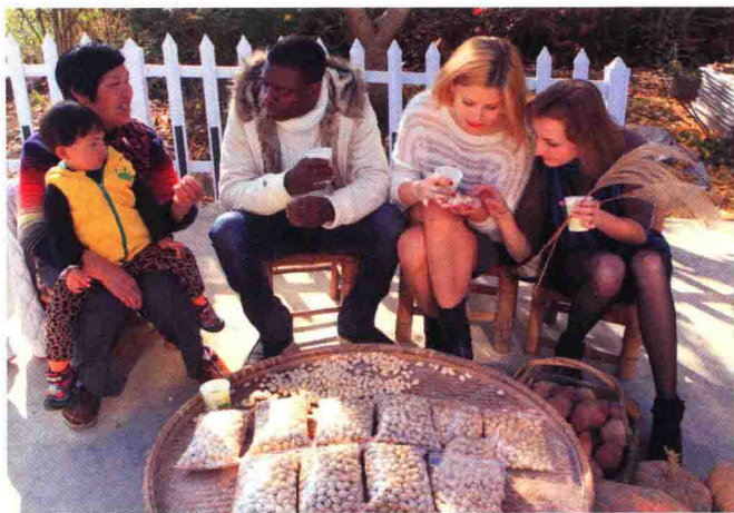
图1-1 游客与当地居民话家常