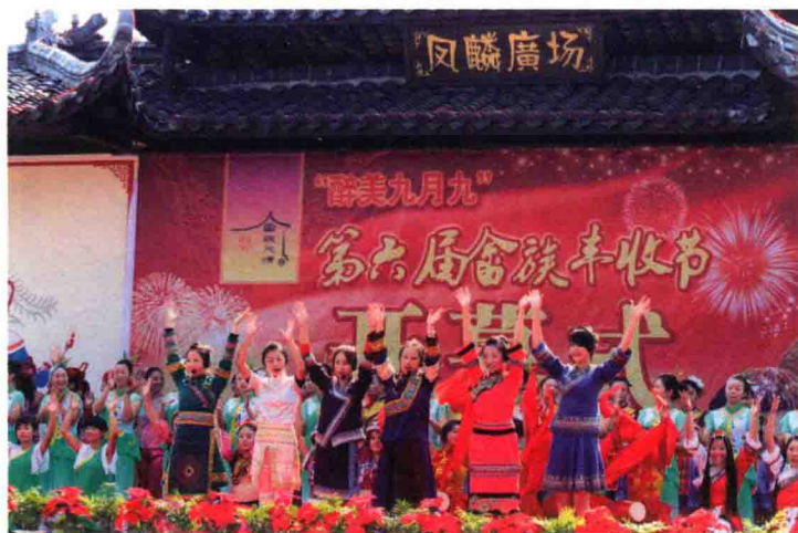
图1-5 畲族丰收节活动现场

其次是“生态日”号召下的生态理念深入人心。设立了全国第一个生态日，人大、政协主动监督，部门主动履职，群众自觉行动，每