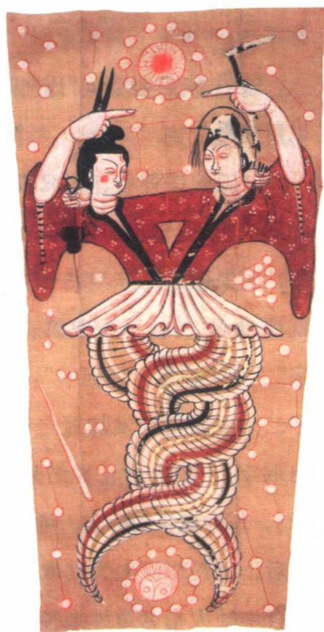
新疆吐鲁番出土的唐朝伏羲女娲绢画