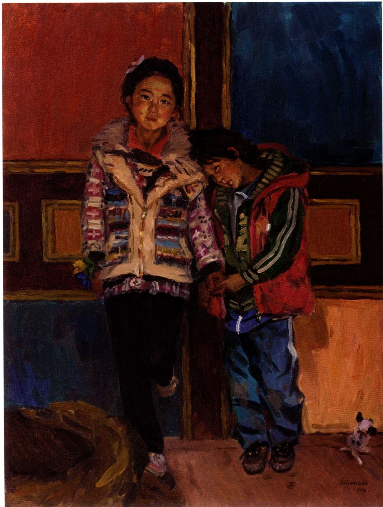
多儿沟姊妹 布面油彩 80 cm x 60 cm 2014