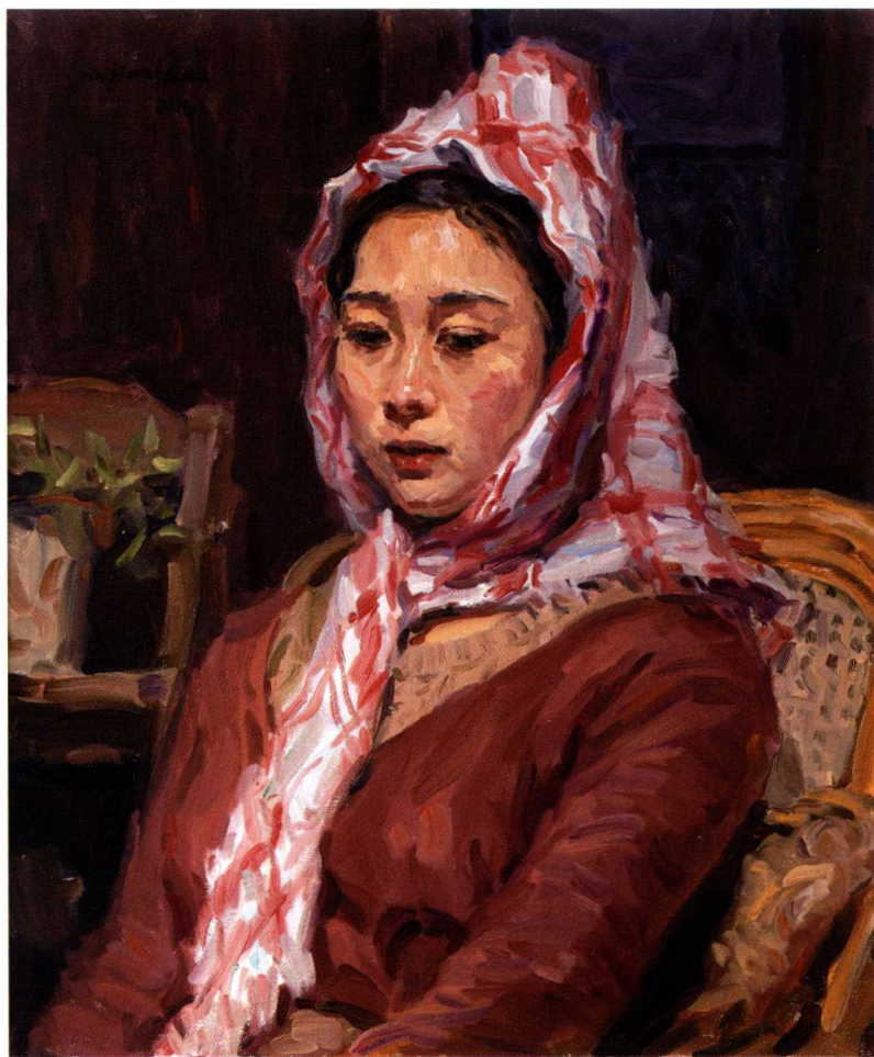
忧伤的女孩 布面油彩 60 cm x 50 cm 2016