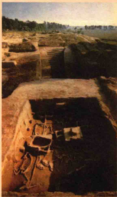
←北京房山琉璃河燕国墓地

燕依靠坚固的城池，守卫边疆，保护农耕文明免受北方游牧民族的侵扰。燕地男子自古多豪客，其实也是地理环境造就的。