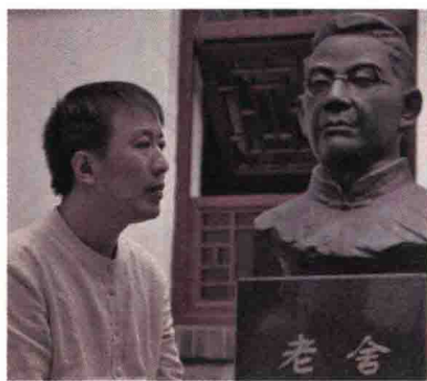
魏新，文化学者，全国青联常委， 央视《百家讲坛》主讲人。