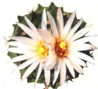
帝冠 Obregonia denegrii