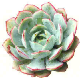
花月夜 Echeveria pulidonis