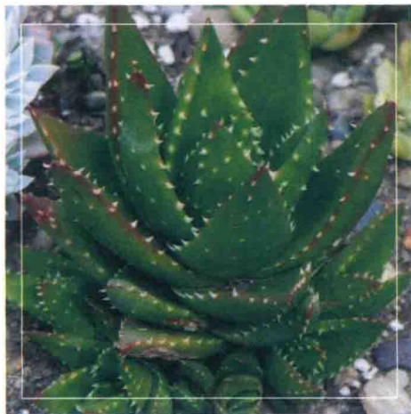
不夜城 (高尚芦荟、大翠盘) Aloe mitriformis

芦荟属约有300种，为多年生草本植物。植株多无茎或茎短。具有肉质叶子，叶簇生于基部呈莲座状或二列状，叶端锐尖有硬齿或尖刺，叶缘常有硬刺。花多朵排成总状花序或伞状花序，雄蕊生于基部。花丝、花柱较长，花被呈圆筒状，有时会变弯曲。蒴果附多数种子。喜光耐旱，忌积水，易于栽种，花叶兼具美感，有一定的观赏价值和药用价值。