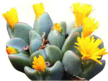
少将 Conophytum bilobum