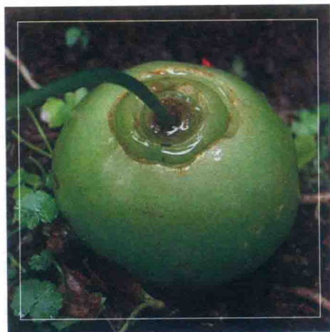
大苍角殿 Bowiea volubilis

苍角殿属仅有2~3种，主要分布在南非、坦桑尼亚。为多年生草本植物，植株呈肉质鳞茎，直径可达20~30厘米。鳞茎表皮光滑呈绿白色，大部分露出地面。