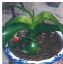
曼氏虎眼万年青（珍珠草） Ornithogalum saundersiae

虎眼万年青属约有100种，为多年生草本被子植物，耐寒，不耐高温，夏季高温期需遮光，开花后宜放置室内干燥的环境中。某些品种可供药用。