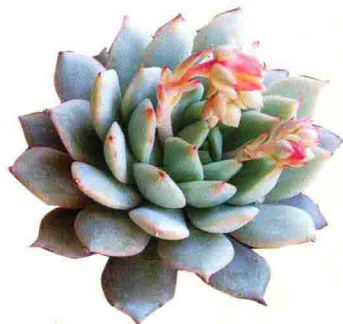
蒂比 Echeveria 'Tippy'