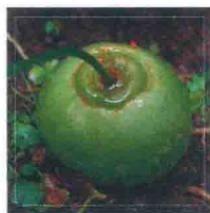
大苍角殿 Bowiea robusta

苍角殿属仅有2-3种，主要分布在南非、坦桑尼亚。为多年生草本植物，植株呈肉质鳞茎，直径可达20-30厘米。鳞茎表皮光滑呈绿白色，大部分露出地面。