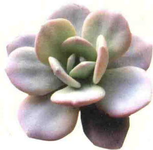
雪莲 Echeveria 'Lauli'