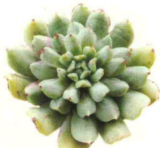
爱尔兰薄荷 Echeveria 'Irish Mint'