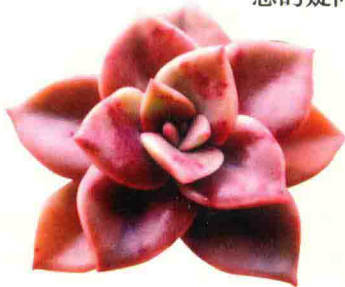
旭鹤 Echeveria atropurpurea