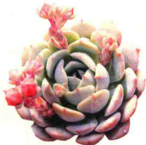
多多 Echeveria 'Dondo'