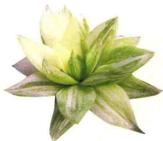
京之华锦 Haworthia cymbiformis f. variegata