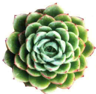
酸橙辣椒 Echeveria 'Lime&Chili'