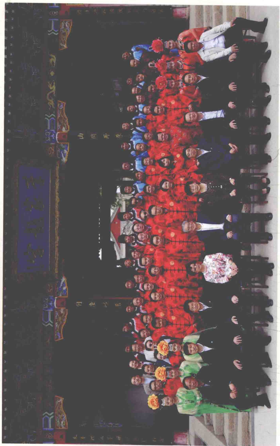
全国人大原副委员长李铁映来陇西视察，在陇西堂前合影