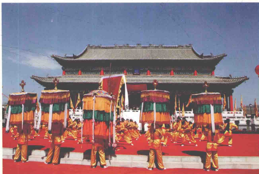
丰富多彩的文化旅游节活动