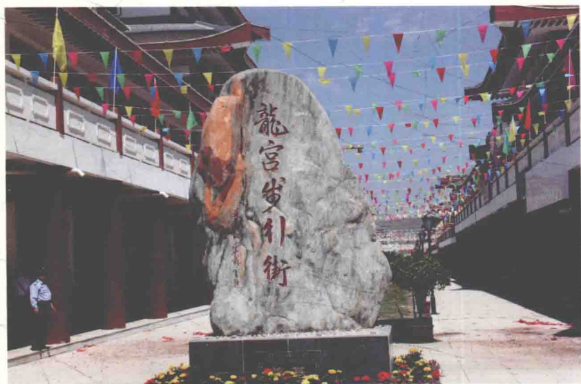
陕西李氏文化仿古一条街