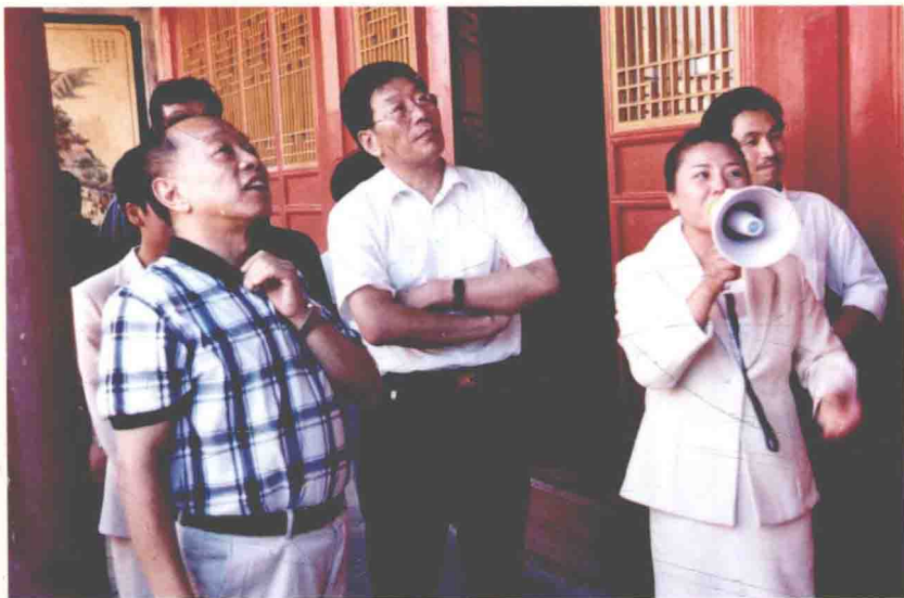
外交部原部长李肇星参观陇西堂