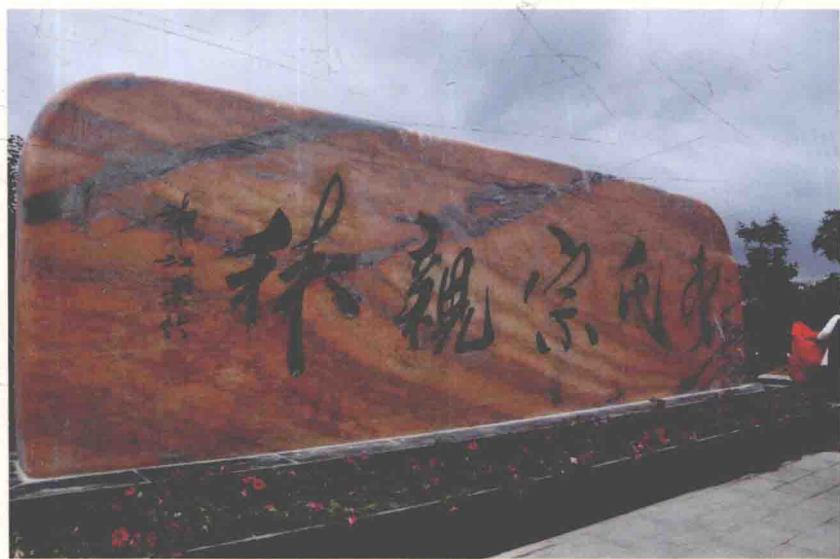
李氏宗亲林碑刻，由全国人大原副委员长李铁映题字