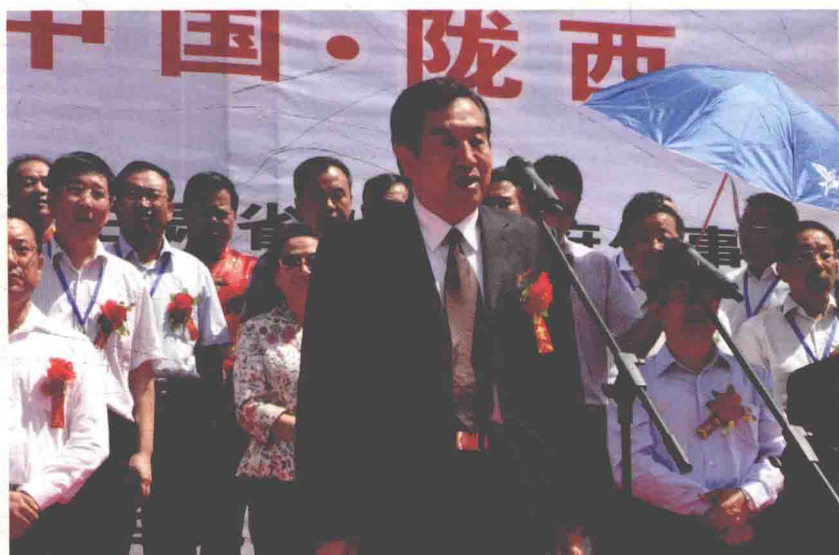
全国政协原副主席李蒙宣布陇西文化旅游节开幕