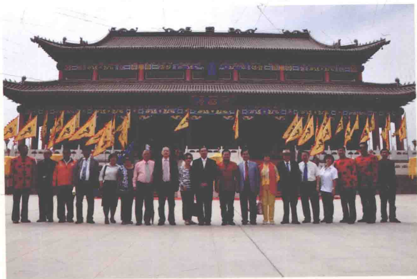
海内外李氏宗亲在陇西堂前合影