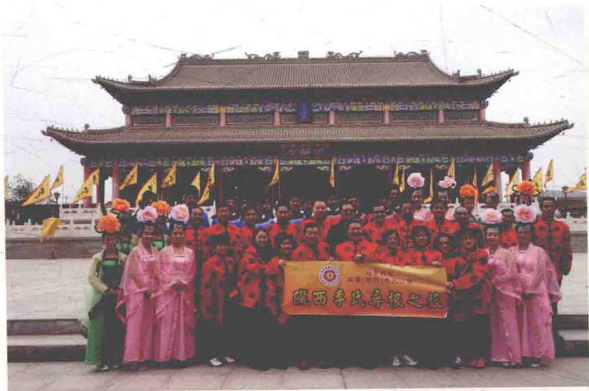
海内外李氏宗亲来陇西堂寻根问祖