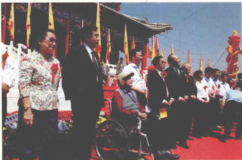
甘肃省委原书记李子奇参加文化旅游节活动