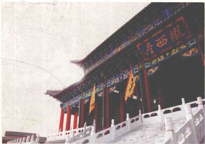
陇西堂位于陇西县城北关、渭河之滨的李家龙宫公园，分置堂号牌楼、太白酒楼及迎宾区、朝祖区、祭祖区等建筑群。图为中院主祭堂。