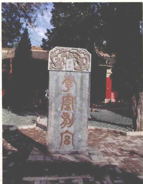
李家龙宫东大门及园 内石碑