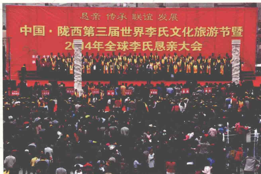
海内外李氏宗亲来陇西堂寻根问祖