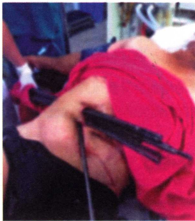
图 1-1 高处坠落事件

【案例】某厂工作人员在高空作业时未系安全带，未穿防滑鞋，作业中因脚手架板上有油不慎滑倒，从3m高处坠落，正好被地面上的钢筋穿透身体（见图1-1），当场死亡。