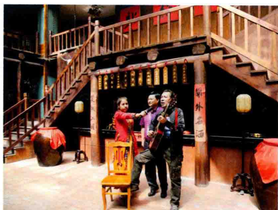
白水洞少数民族歌唱家为作家们纵情歌唱