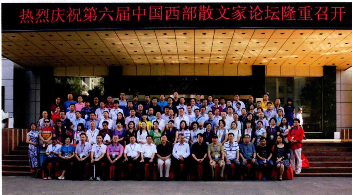
第六届中国西部散文家论坛合影