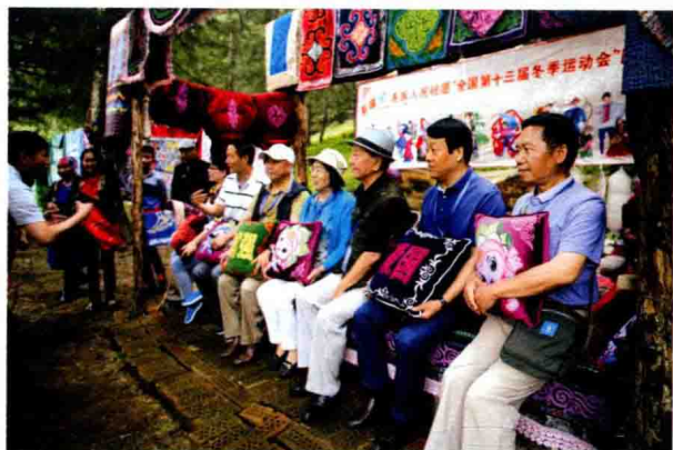
作家体验白杨沟民族风情