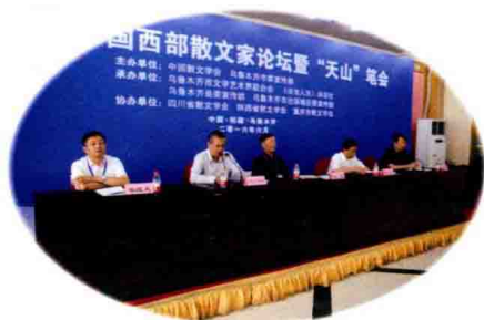
自治区文联副主席 阿拉提·阿斯木在开幕式上讲话