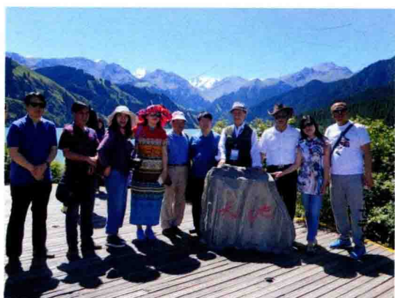
天池采风纪念合影