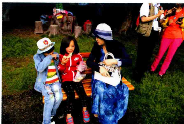
作家与哈萨克族小朋友交流