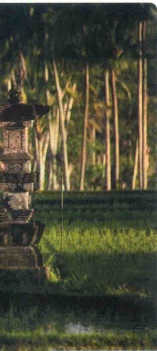
在稻田间劳作的男人 乌布德(见263页), 巴厘岛