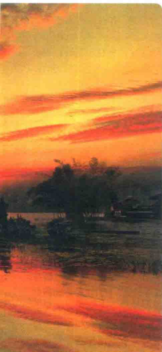
水神庙(见306页),巴厘岛