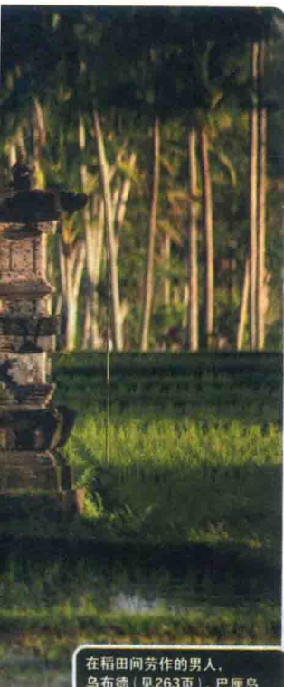
在稻田间劳作的男人， 乌布德（见263页），巴厘岛