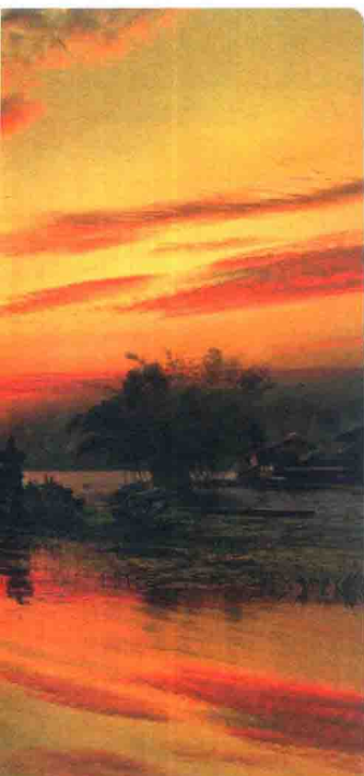
水神庙 (见306页), 巴厘岛