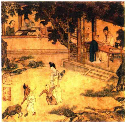
▲ 琴天籍(lài) 閩宋人画册(之一)，描绘了古代教育孩子读书的情形。明代仇英绘

这本《弟子规》，出自圣人孔子的教导。首先要孝顺父母，敬爱兄长，其次要言行谨慎，诚实守信。要博爱众人，亲近有仁德的人。如果还有多余的精神，就去学习文化知识。