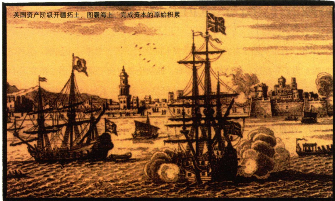
英国资产阶级开疆拓土，图霸海上，完成资本的原始积累