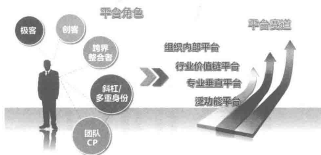
图 1-1 平台 + 个人的新生态圈