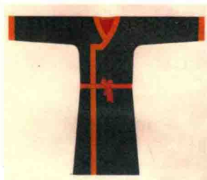
春秋战国时期的服装