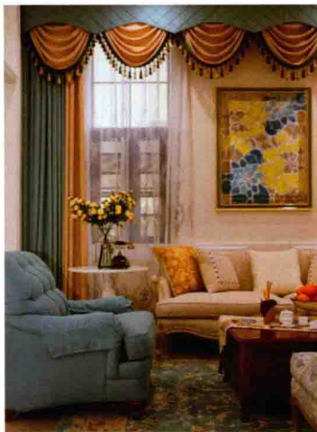
家具、布艺类功能性软装