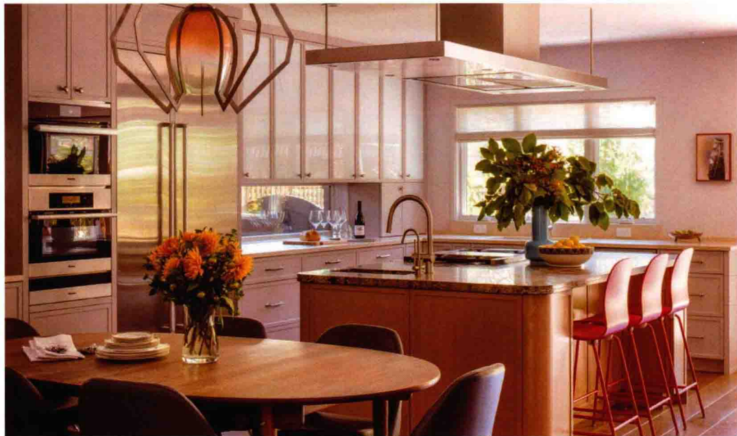
清新高雅的艺术氛围