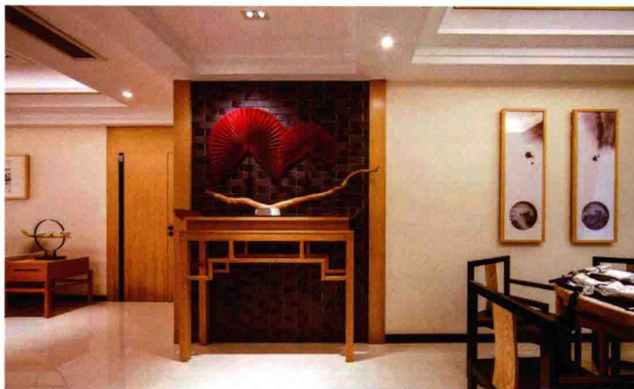
在素雅的空间中，红色的工艺品成为视觉中心点