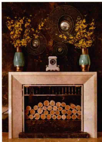
工艺品类装饰性软装

从功用方面，可以把软装分为功能性软装和修饰性软装两大类。功能性软装指的是家庭中必不可少的软装，要满足日常生活的需求的物品，如家具、布艺、灯具、餐具等。修饰性软装是指可以烘托环境气氛，强化室内空间特点的工艺品，如装饰画、工艺摆件、插花等。