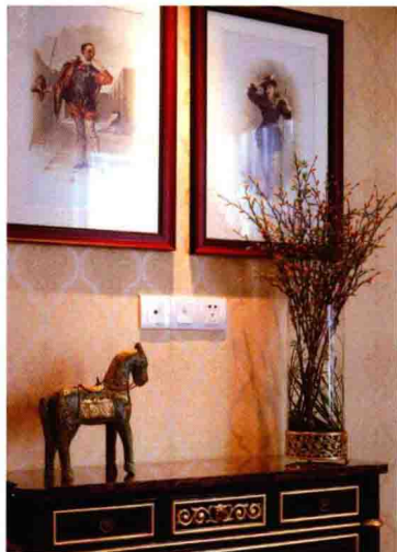
高低错落的工艺品摆件

软装布置应遵循多样与统一的原则，根据大小、色彩、位置使之与家具构成一个整体。家具要有统一的风格和格调，再通过饰品、摆件等细节的点缀，进一步提升居住环境的品位。例如，可以将淡黄色系作为卧室的主色调，但在床头背景墙上悬挂一副绿色的装饰画作为整体色调中的变化。