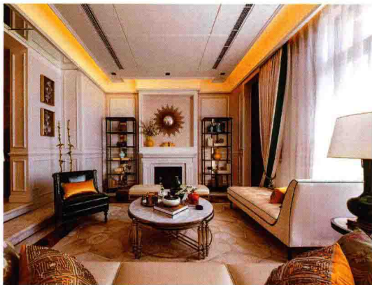
素雅欧式的软装定位

很多人以为，完成了前期的基础装修之后再考虑后期的配饰也不迟，其实不然。软装搭配需要尽早规划，在新房装修之初，就要先将自己的习惯、好恶、收藏等全部列出，并与设计师进行沟通，使其在考虑空间功能定位和使用习惯的同时满足个人风格需求。