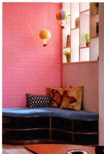
形态各异的工艺品