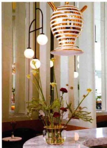
插花、灯具类装饰性软装