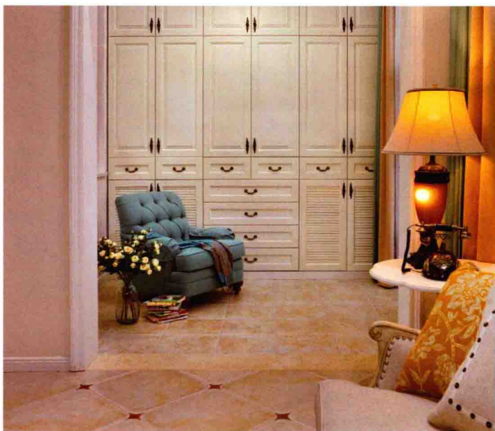
在白色衬托下，蓝色沙发更为夺目