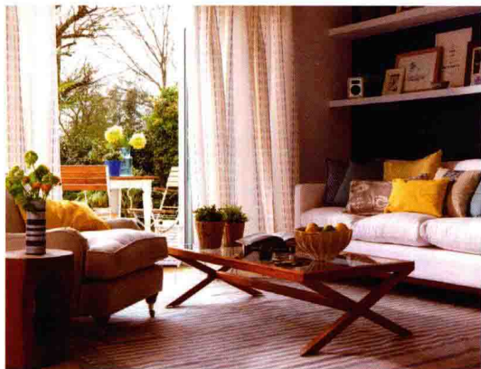
现代简约的软装定位