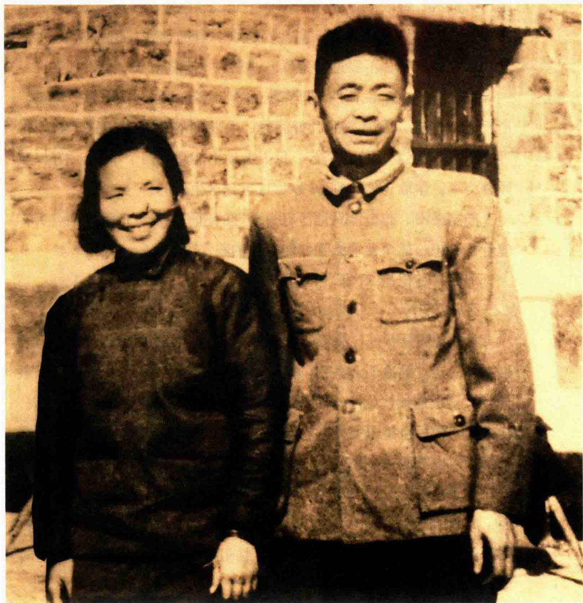
刚刚回到江西农村不久的龚全珍与甘祖昌