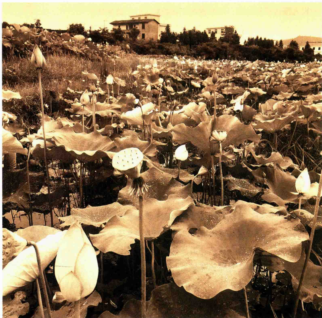
自唐代始，莲花县即以种植莲花闻名，至今县城附近随处可见荷塘