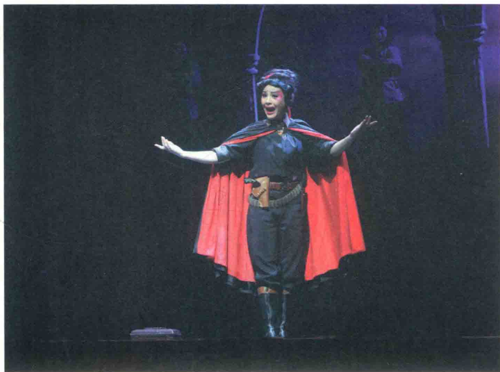
吴非凡主演粤剧《碉楼》