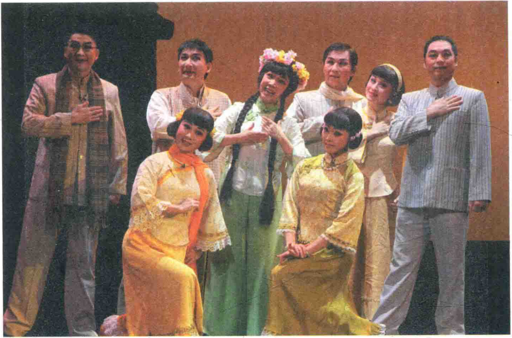
倪惠英主演粵劇《三家巷》