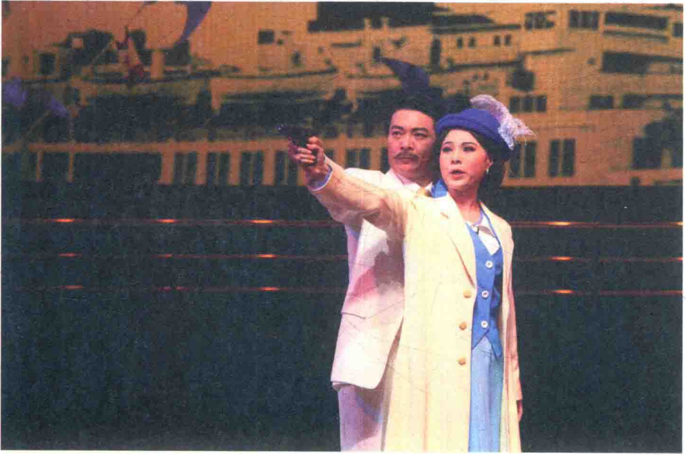
欧凯明（左）、崔玉梅（右）主演粤剧《孙中山与宋庆龄》