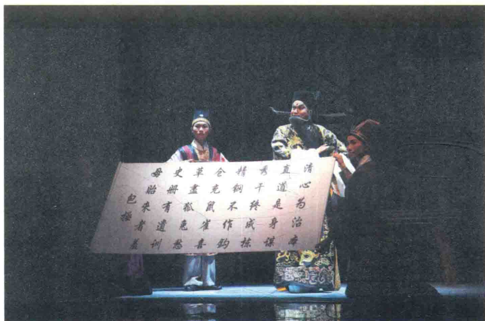
李秋元（中）主演粵劇《包公還硯》