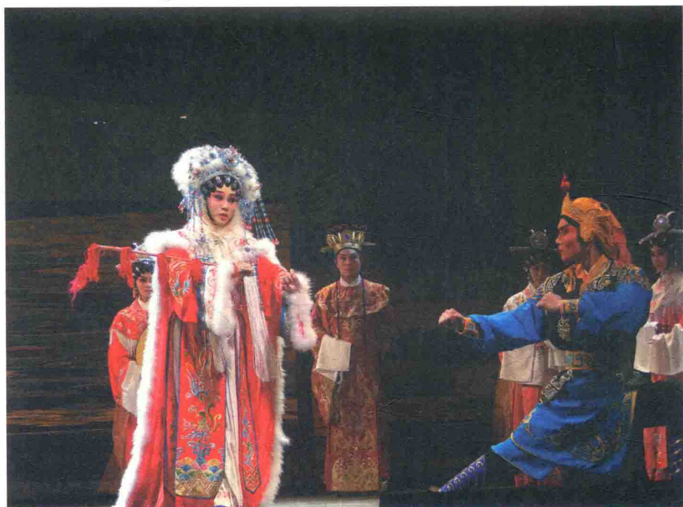
崔玉梅主演粵劇《昭君出塞》