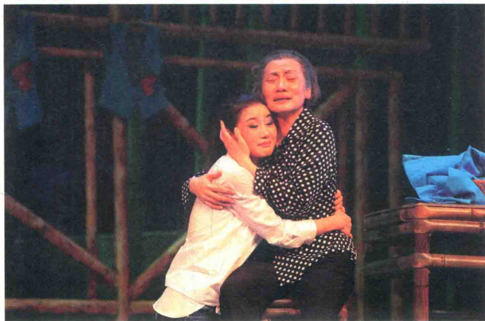
曾小敏（左）、李红涛（右）主演粤剧《青春作伴》