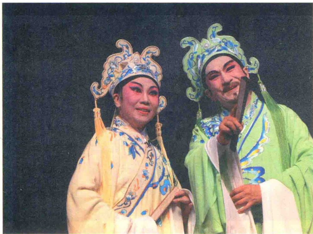
曾慧(左)、麦嘉(右)主演粤剧《痴情英台苏山伯》