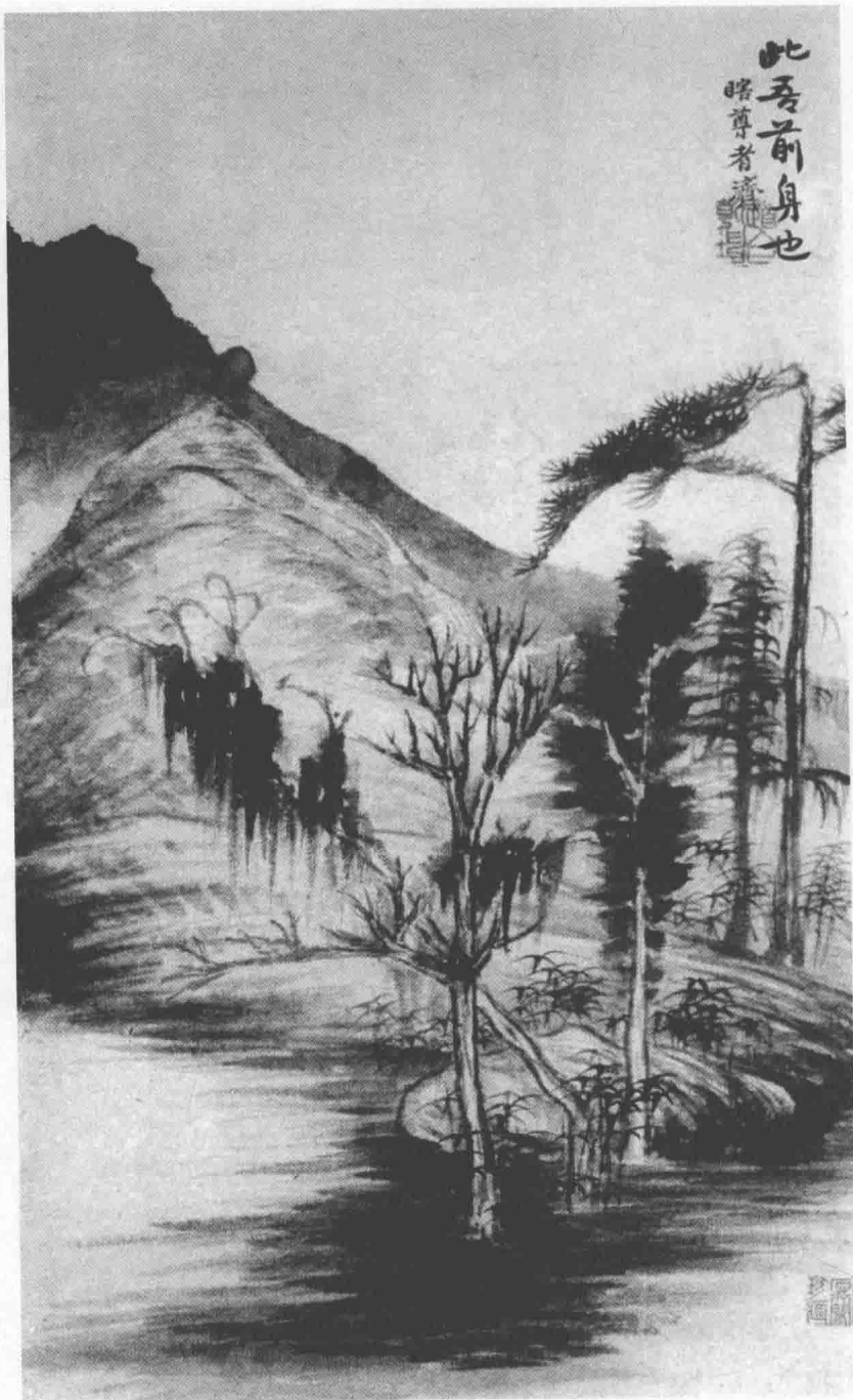
>> 小品山水 石涛