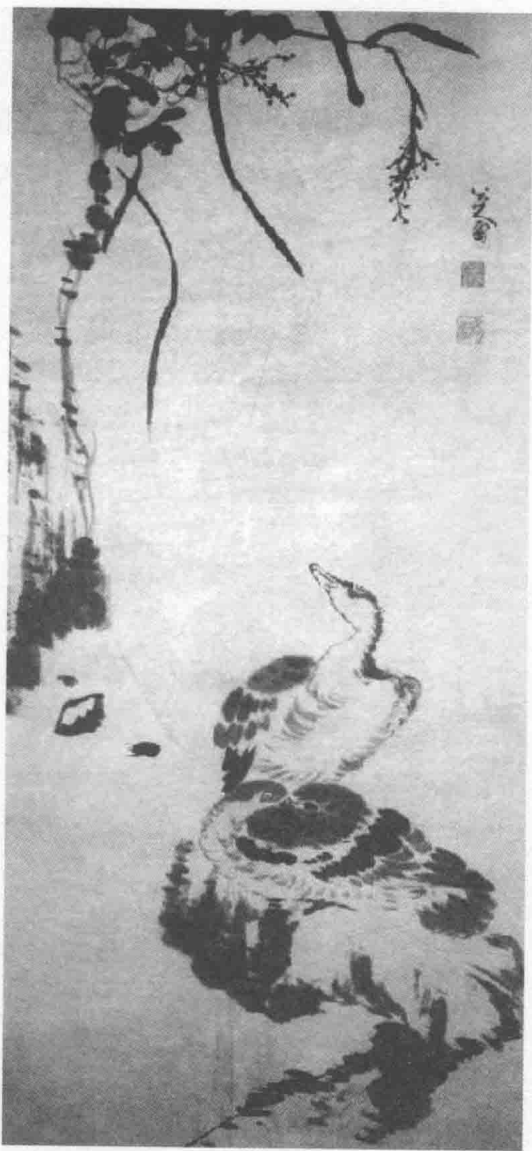
>>芙蓉芦雁图 八大山人