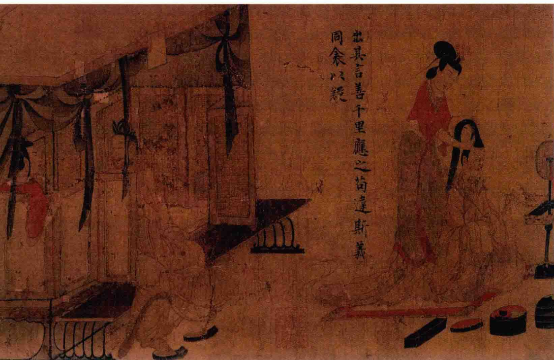
东晋 顾恺之《女史箴图》