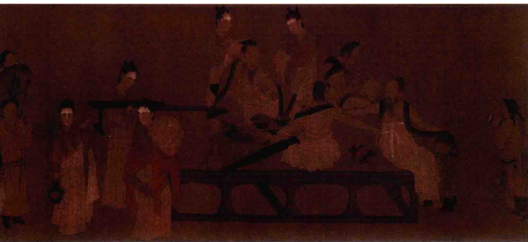
北齐 杨子华《校书图》