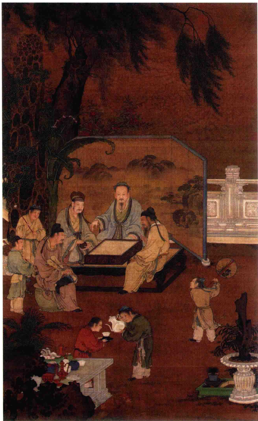
明《十八学士图》之会棋图