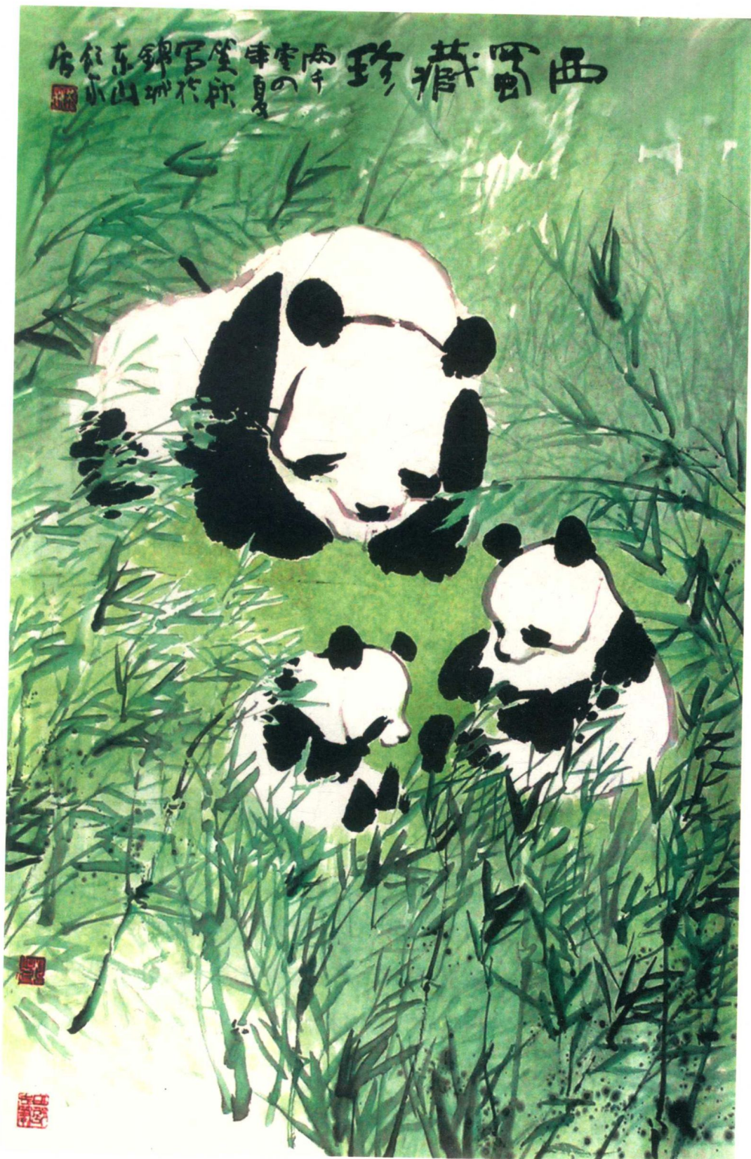
邱笑秋作品 西蜀藏珍