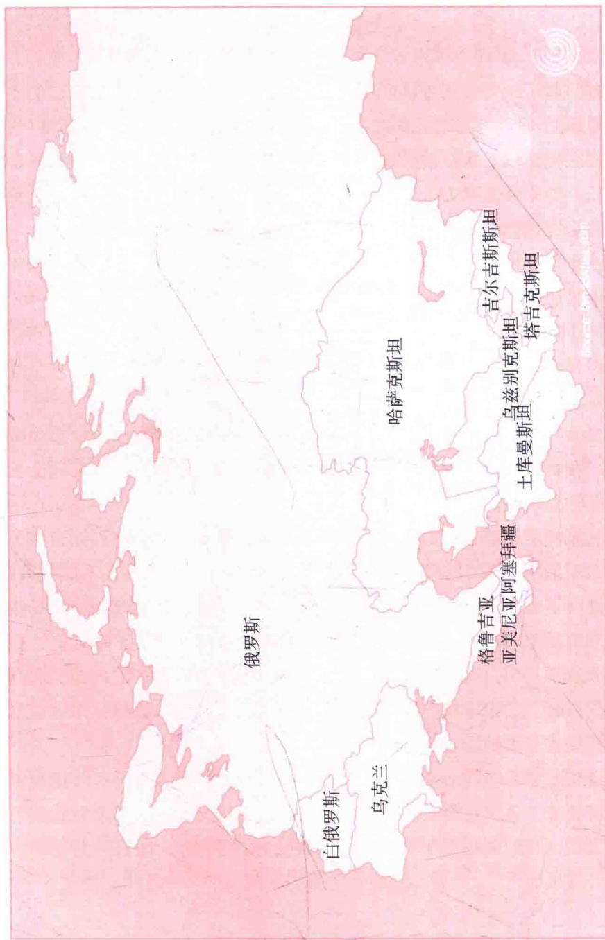
图1.1 独立国家联合体 (CIS)