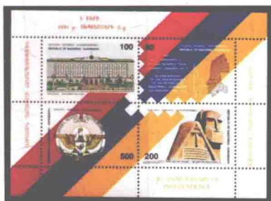
“传说”中的纳戈尔诺—卡拉巴赫小版张纪念邮票