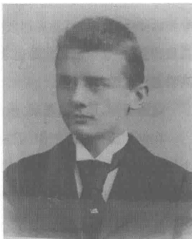
约翰·拉贝年轻时的照片

青年时期形成的人生观、世界观，必将在他人生的漫漫长途上投下清晰的剪影。我们可以在拉贝的人生之路上寻找到无数这样的投影，自由和人性、人的价值和人的尊严，这些人道主义的理想自始至终贯穿了他的一生。