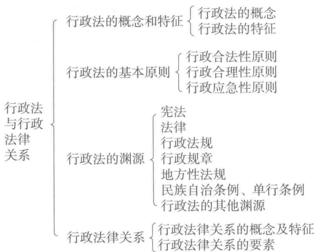
图 1-2 行政法与行政法律关系内容框架