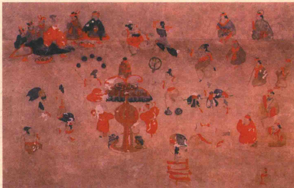
↑ 匈奴古墓杂技壁画

出土于匈奴古墓的杂技壁画，描绘古代匈奴人杂耍的场面。图中观看杂技表演的既有贵族，也有一般百姓，为研究古代匈奴的生活状况提供了珍贵史料。