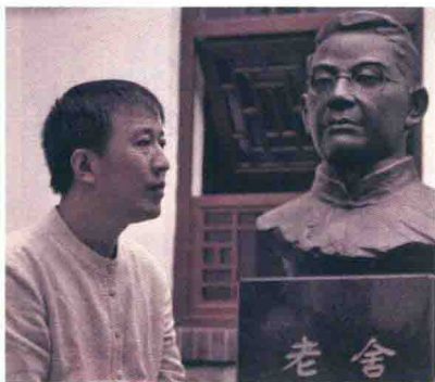
魏新，文化学者，全国青联常委， 央视《百家讲坛》主讲人。