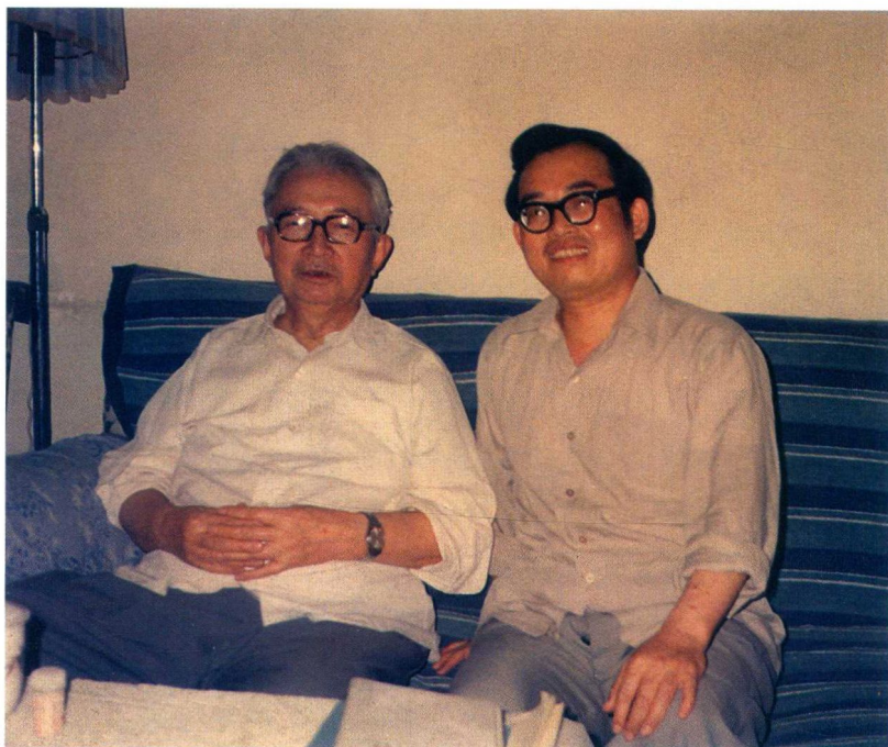
与白寿彝先生合影 / 1985 年