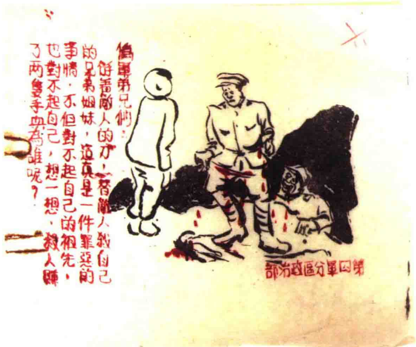
晋察冀军区第四军分区政治部的中文传单（制作时间：1942年7月左右）