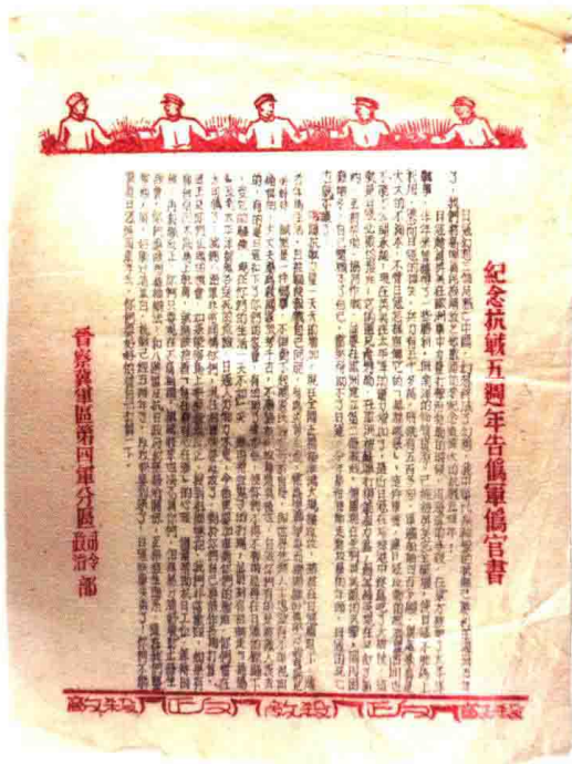
晋察冀军区第四分区司令部、政治部的中文传单《纪念抗战五周年告伪军伪官书》(制作时间：1942年6月左右)