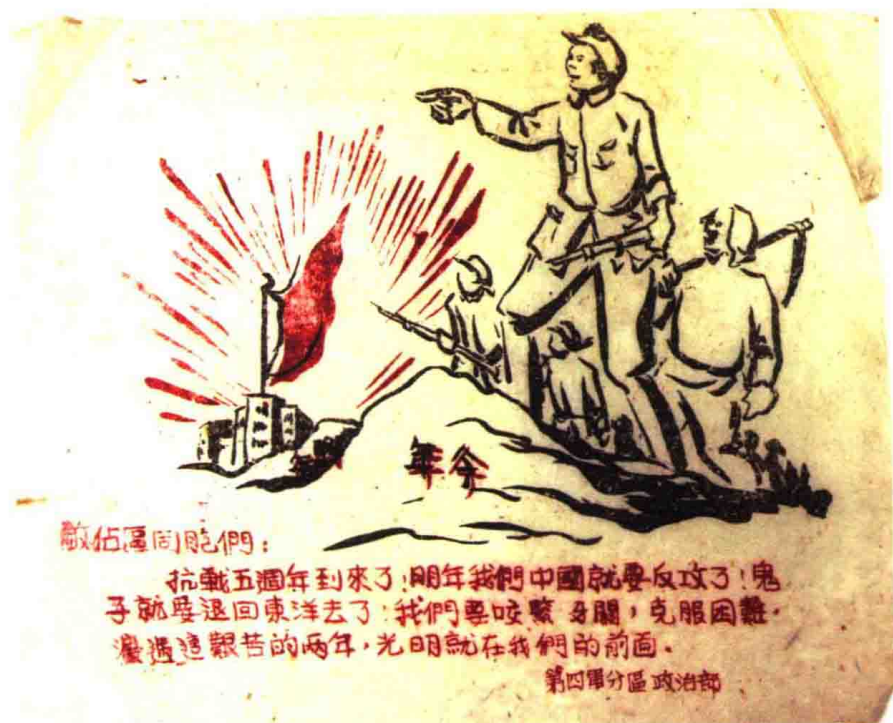
晋察冀军区第四军分区政治部的中文传单（制作时间：1942年7月左右）