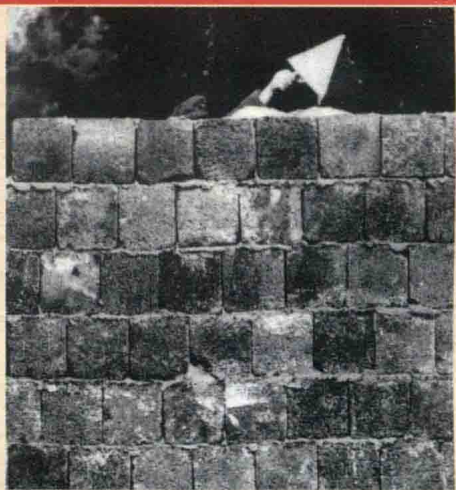
↑ 由东德主导建筑的柏林墙

1961年8月，东德开始修建柏林墙，将西柏林封锁在高墙之内。照片为一名东德工人正在修建柏林墙。柏林墙不仅割裂了一个城市，而且使两大阵营的对抗更趋白热化。