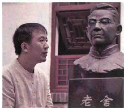
魏新，文化学者，全国青联常委， 央视《百家讲坛》主讲人。