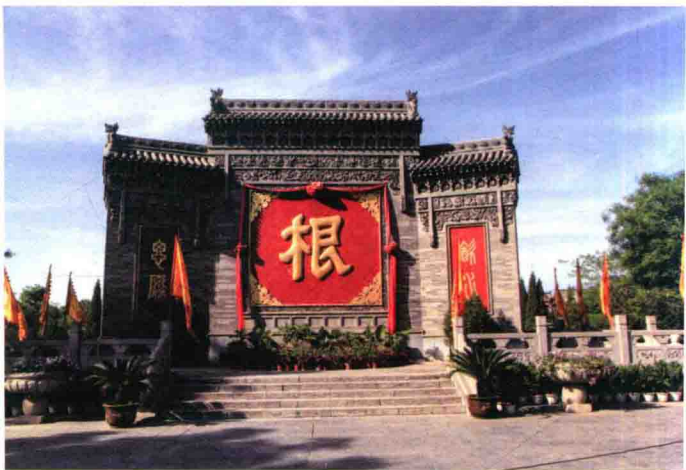
寻根问祖、落叶归根是华夏民族永远抹不去的故乡情结

在中国历史上，有多处地方经常被中国移民提及，其中有山西洪洞的大槐树、江苏苏州的阊门和