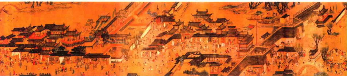
明朝仇英的画作《清明上河图》中展现了苏州热闹的市井生活和民俗风情

的《新安镇源流》就有这样的记载：“大明洪武登极之初，虑大族相聚为逆，使各道武员，率游骑击散，谓‘洪武赶散’……而苏之阊门周姓、常之无锡惠姓，以及刘、管、段、金皆被赶散，来至朐南（原海州以南地区），芦苇荒滩，遂各插草为标，占为民地……后人烟渐繁，乃诣州请为州民，州牧载入版图，是为里人。”直到今天，这里的几十万人都说来自苏州阊门。现大多数苏北人把睡觉戏称为去“苏州”，体现了当时苏州移民迁徙过程中念念不忘祖籍地，数百年不忘故乡的情结。据一些专家统计，祖籍是苏州者，主要分布在扬州、淮阴、盐城三个地区。移民分布东到大海，北到江苏北部省界，西部、南部基本上以京杭大运河为界，这一地域范围内有今扬州、邗江、江都、泰州、姜堰、兴化、泰兴、高邮、宝应、淮阴、淮安、灌南、沭阳、宿迁、泗阳、涟水、盐城、响水、滨海、阜宁、射阳、建湖、大丰、东台、新浦、东海、灌云等地，其中以姜堰、兴化、泰兴移民最为集中。至于响水、滨海、射阳、大丰等范公堤以东地区的苏州移民，可能是苏州移民后裔二次或三次迁徙形成的。在这片地域范围内，自称苏州移民后裔的在80%以上。如此多的移民是否都是苏州人，对此专家有不同的看法，但不管他们是苏州人还是苏州周边地区的人，都有关于“阊门”的集体记忆，或许是因为