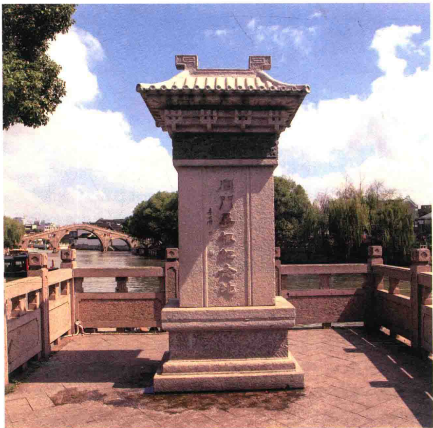
苏州“阊门寻根纪念地”

阊门是苏州城内的八个门之一，位于城西，名字取自“天通阊阖风”（阊阖是传说中的天门）。明朝时期这一带曾经是苏州最繁荣的商业街区，阊门也因此成为当时苏州的代名词，今天仍然是苏州的商业中心之一。为了纪念“洪武赶散”这一历史事件，更为了方便移民后裔回阊门寻根，苏州市在阊门码头附近相继修建了“思乡树”“朝宗阁”“阊门寻根纪念