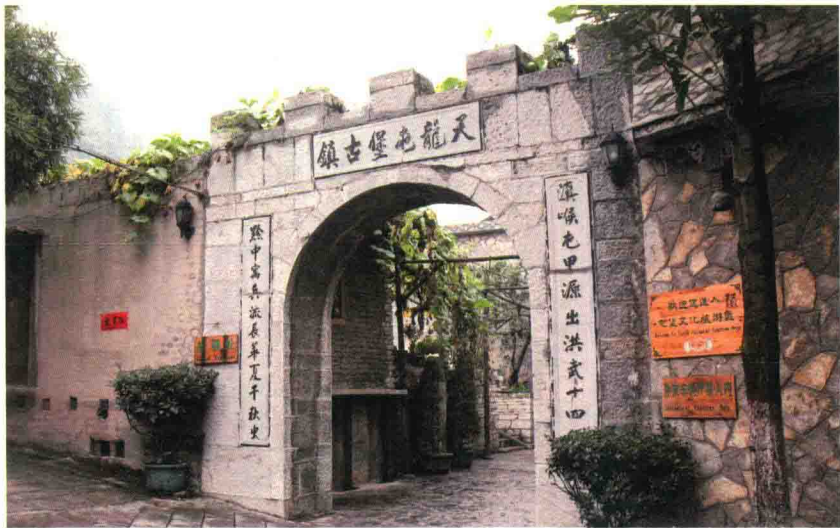
贵州天龙屯堡是明朝设置的军事屯堡的重要遗存

除上述三处明代移民圣地外，还有广东南雄珠玑巷、江西瓦屑坝、湖北麻城孝感乡、山东枣林庄、福建宁化石壁村、河北小兴州等历朝历代的移民祖居地。