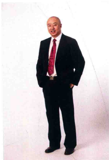
东易日盛装饰集团董事长 中央国家机关青联委员 中国建筑装饰协会常务理事 中装协专家委员会委员 中国建筑学会竞赛委员会委员 北京市装协家装委员会副会长 中国青年企业家协会理事

随着人们物质生活和精神需求的不断提升，“轻装修、重装饰”的环保理念，早已成为家居装饰界的共识。纵观近年来国内家装市场的发展状况，不难发现众多业主在装修观念上发生了巨大变化。几年前，很多人还只是粗略地认为“家居装饰”也就是选选灯具、换换窗帘……而如今，“软装”这个包含了家具、灯饰、布艺、饰品等诸多元素的专业术语，已然变成了耳熟能详的热词，受到越来越多追求个性时尚以及高品位生活的消费者追捧。