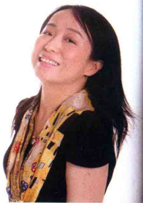
《INTERNI设计时代》中文版执行出版人 《中国国家地理》杂志原制作总监

“把房子倒过来，将地面当作天花板，一切能掉下来的东西，均属于软装范畴！”这个流行于业内人士和消费者口中的软装谚语，看似简单，实则表达了一种扩大空间、改善整体家居环境、突出房主个性风格的陈设装饰艺术。现代家居中，软装设计不仅能在丰富空间层次、强化装饰风格、创造生活意境等方面发挥重要作用，还可以扩展二次空间层次，有效地弥补建筑结构上的缺陷，在增加居住舒适功能的基础上，最大限度地满足房主体现生活品位和艺术审美的视觉感受。