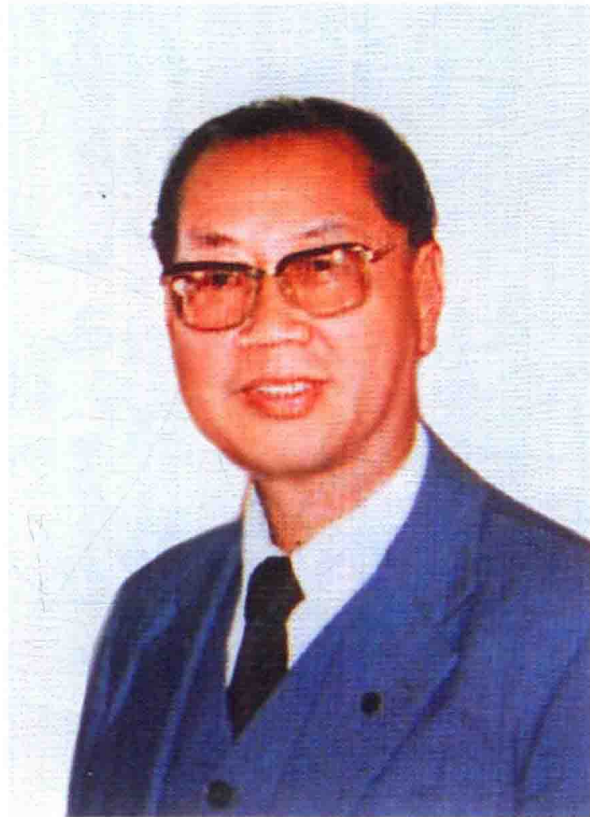
朱良春先生摄于1986年（70岁）