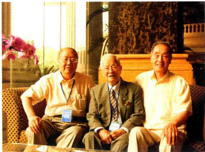
2005年6月，在著名中医学家朱开任继春、老邓在首届“中医学传承”学术论坛上，与著名中医学家、中医学专家、著名中医学家、著名中医学家、著名中医学家合影