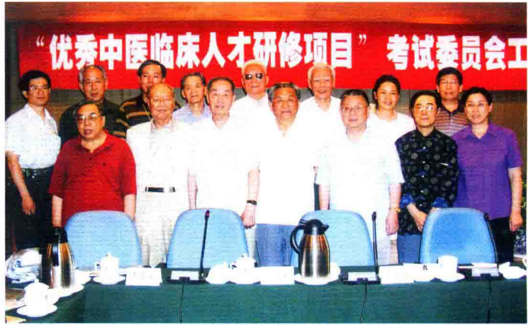
2003年参加国家中医药管理局“优秀中医临床人才研修项目”考试委员会工作会议