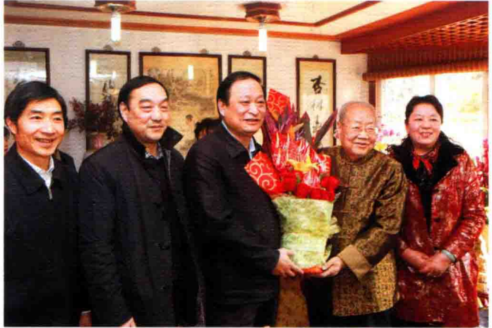
2014年2月15日，国家卫计委副主任、国家中医药管理局王国强局长来到97岁国医大师朱良春教授家，亲切看望朱老。同来探望的有：江苏省卫生厅陈亦江副厅长、南通市政府朱晋副市长、南通市卫生局王晓敏局长等省、市领导