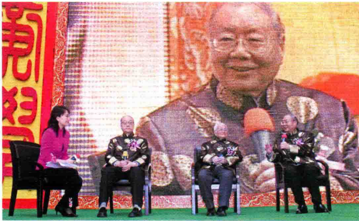
在广东省中医院名师带高徒结业仪式上，邓铁涛、唐由之、朱良春三位导师登台接受中央电视台节目主持人洪涛的访谈