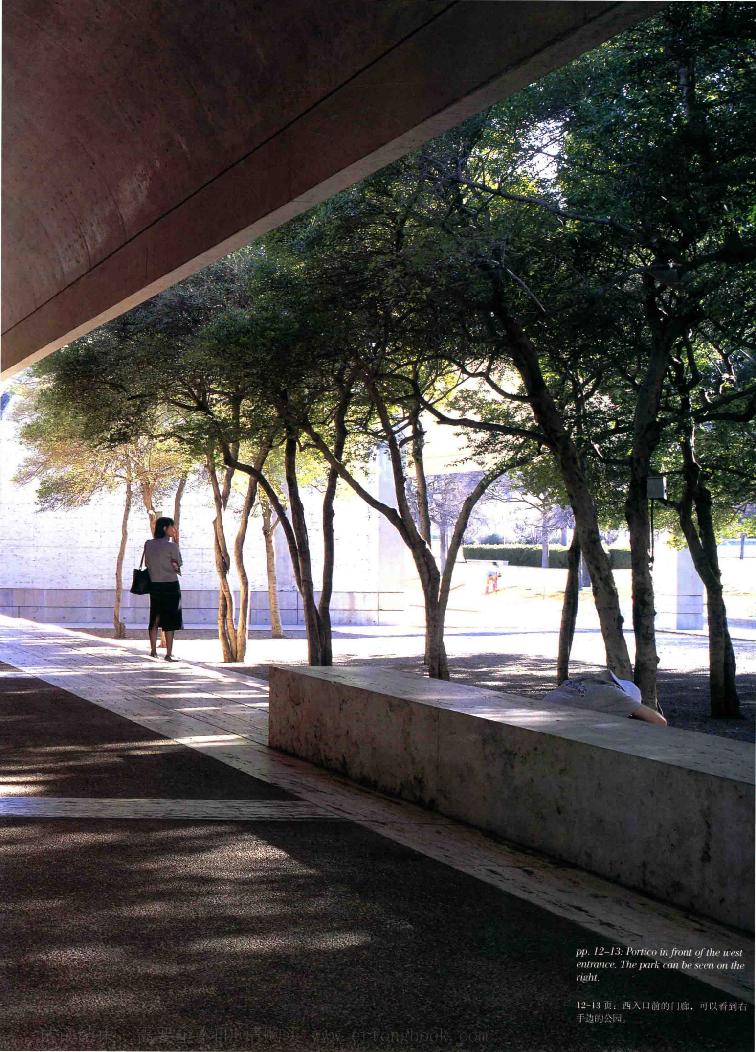
pp. 12-13: Portico in front of the west entrance. The park can be seen on the right.