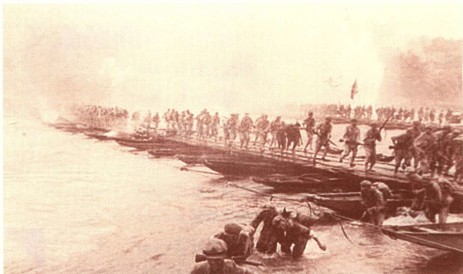
■ 《湘江之战》电影剧照

把自己的人也带出去。可惜，4天前他是可以做到，但现在机会很渺茫了：湘江沿岸各个渡口已完全被封锁，红34师已被截断在湘江东岸。