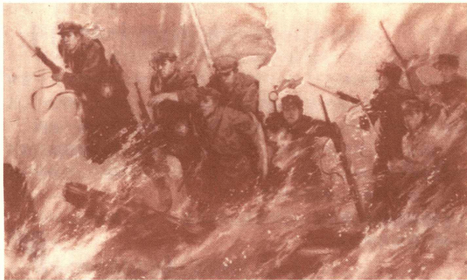
■ 红军强渡大渡河（绘画）